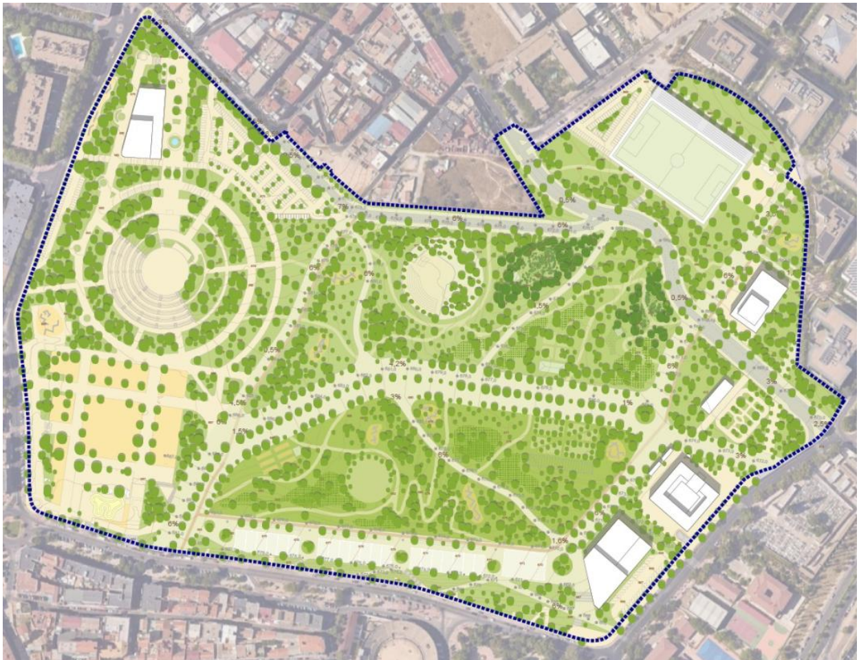
Fig. 5. Detalle del Plano PO.12 – Imagen de la ordenación.

Los elementos de la infraestructura verde son las unidades funcionales de la red estratégicamente planificada de espacios naturales y seminaturales y otros elementos ambientales diseñados y gestionados para ofrecer una amplia gama de contribuciones de la naturaleza a las personas y procesos ecosistémicos. Se definen tres categorías: