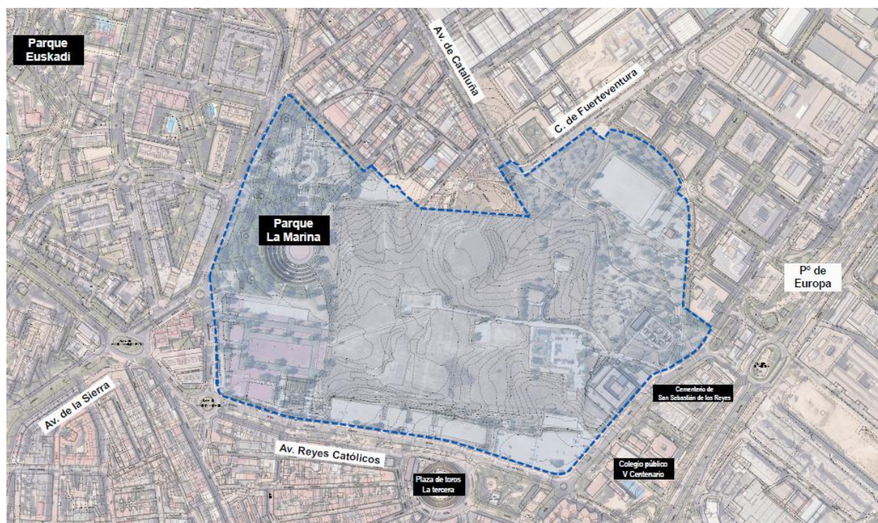
Fig. 1 Vista aérea del ámbito del PE

La superficie total del ámbito, medida sobre la cartografía base municipal, es de 299.319,2 m 2 .