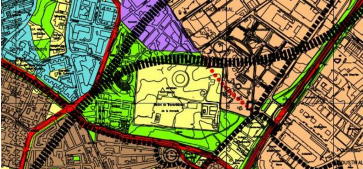
Fig. 2 Imagen del PGOUSS 01. Plano de Elementos de la Estructura Orgánica del Territorio

articula una conexión directa entre la Avenida de Cataluña y el Paseo de Europa para la mejora de la accesibilidad a la trama urbana consolidada al norte del ámbito y una mejora de la relación entre barrios.