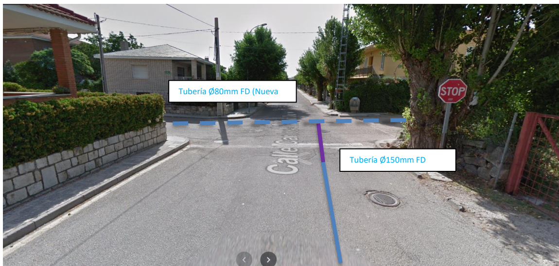
Fotografía 1 Derivación desde la C/ Carlos Jiménez Díaz a C/ San Isidro.

A continuación se adjunta un reportaje fotográfico de las zonas que afectan a Vías Pecuarias, detallando la ubicación aproximada de las tuberías existentes a renovar y ejecutar. Dichas imágenes quedan relacionadas en los planos: