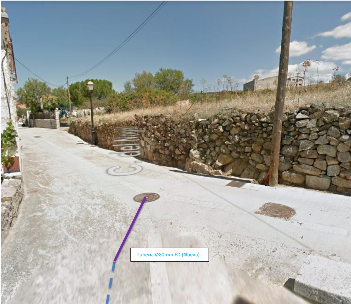
Fotografía 1 Intersección de la calle del Nogal con la calle Olmo.

A continuación se adjunta un reportaje fotográfico de las zonas que afectan a Vías Pecuarias, detallando la ubicación aproximada de las tuberías existentes a renovar y ejecutar. Dichas imágenes quedan relacionadas en los planos: