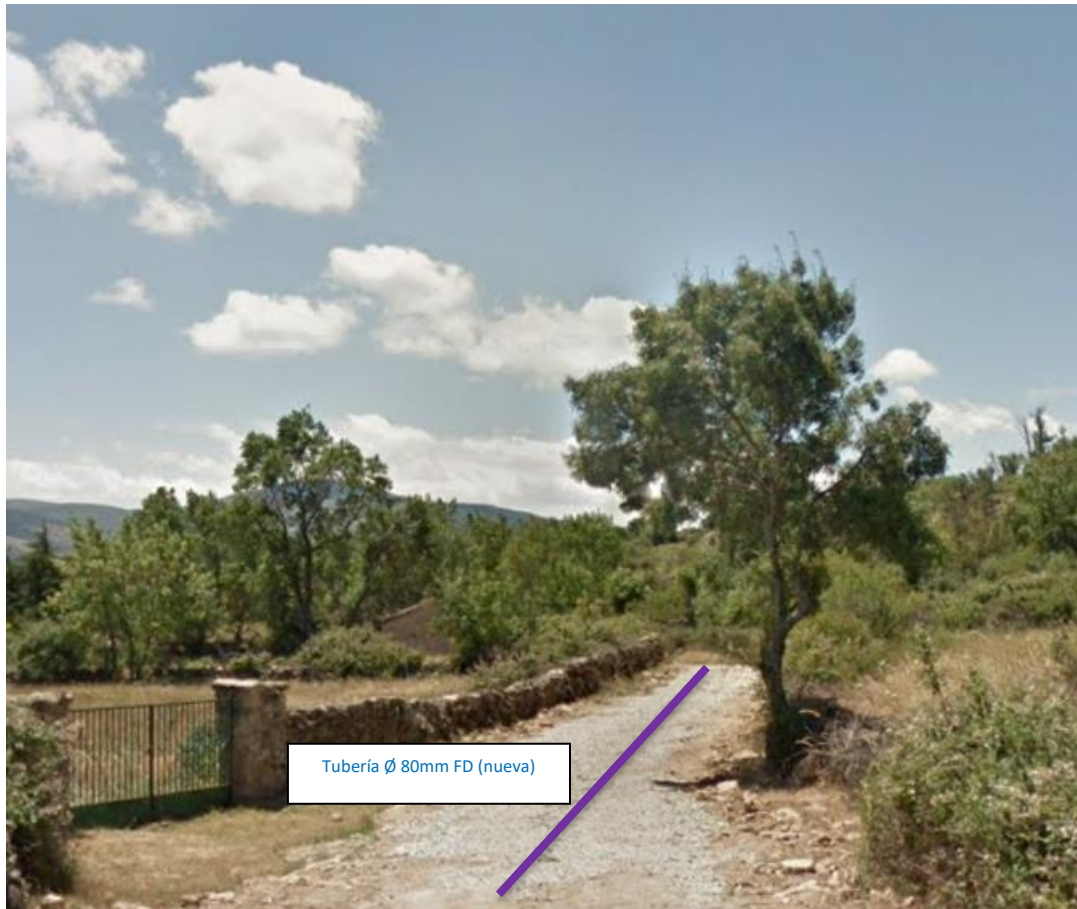
Fotografía 2. Tramo a renovar en el Camino de las Eras