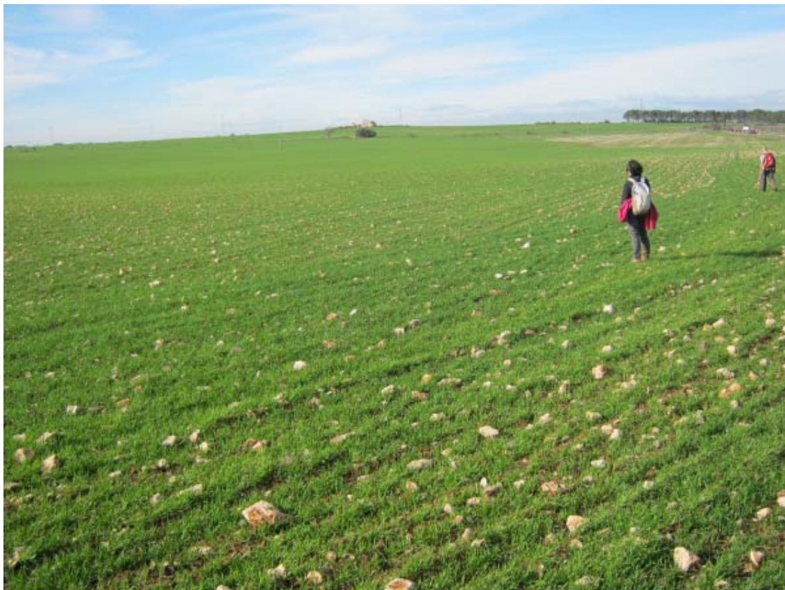
Panorámica del ámbito de la PSFV Portalón (2)