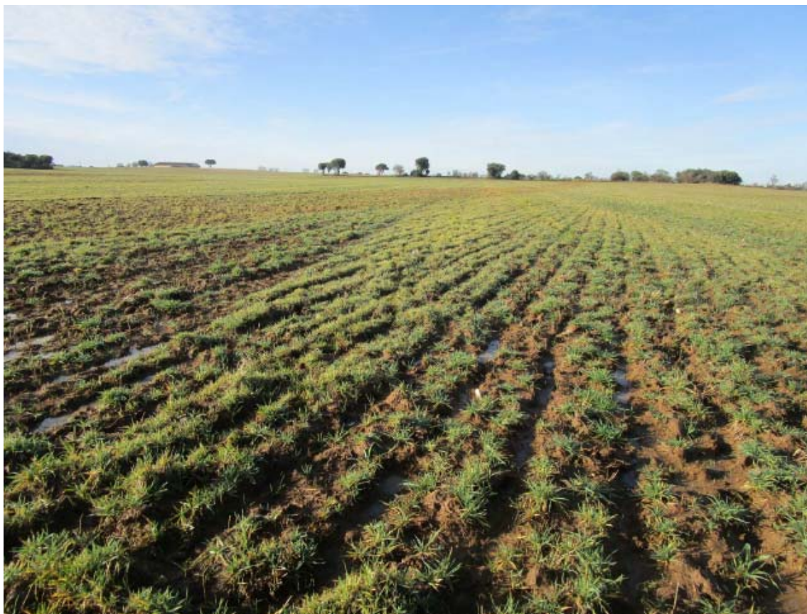
Panorámica del ámbito de la PSFV Spinnaker (2)