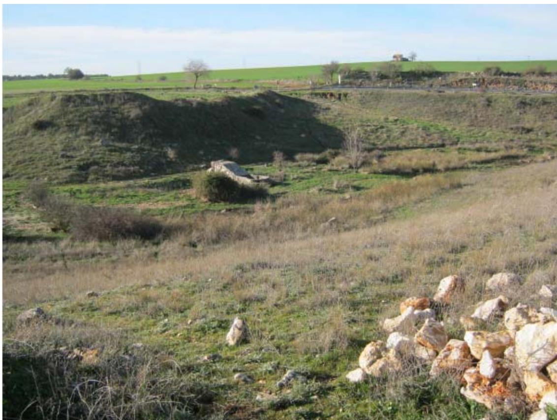
Panorámica del ámbito de la PSFV Portalón (3)