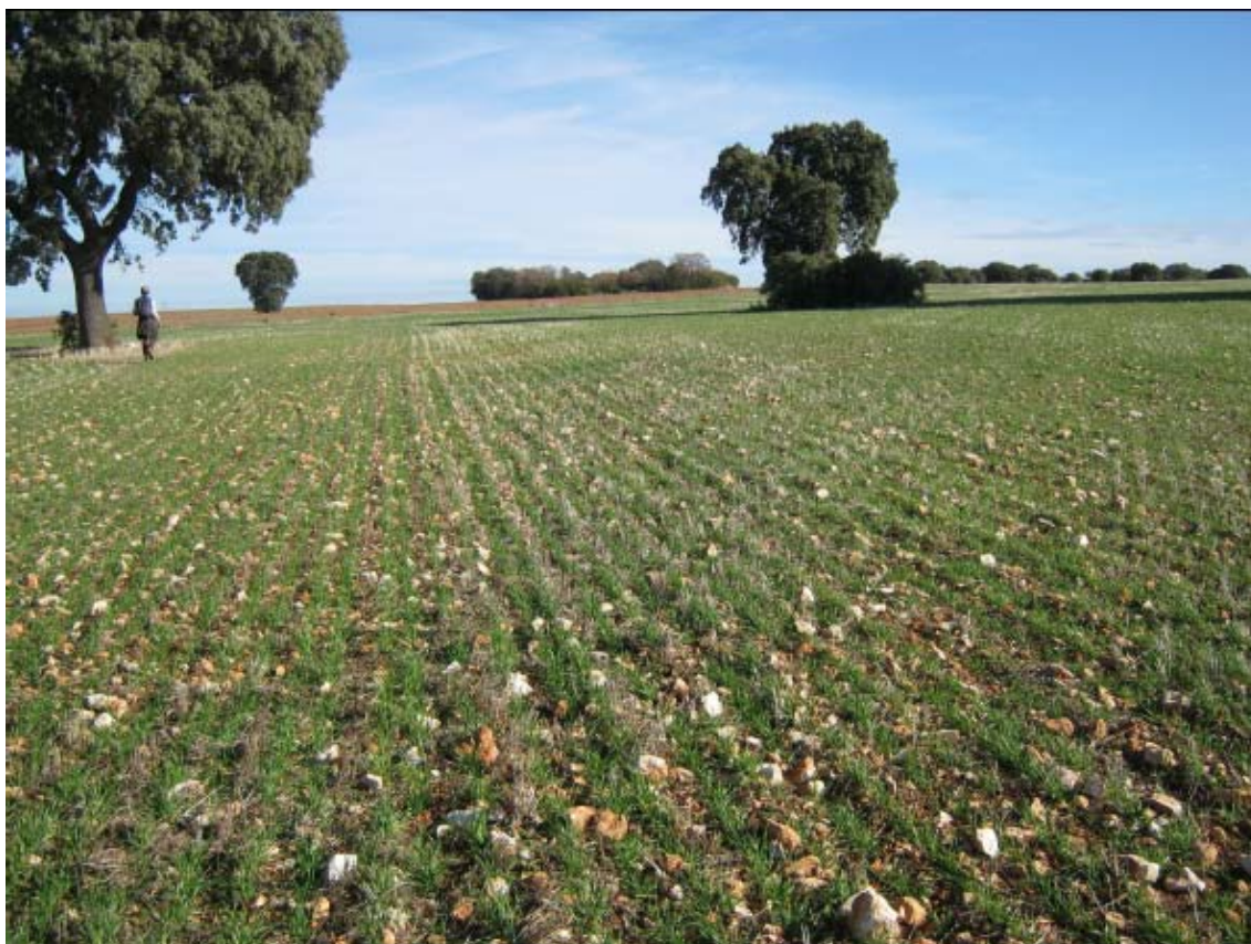
Panorámica del ámbito de la PSFV Quilla (3)