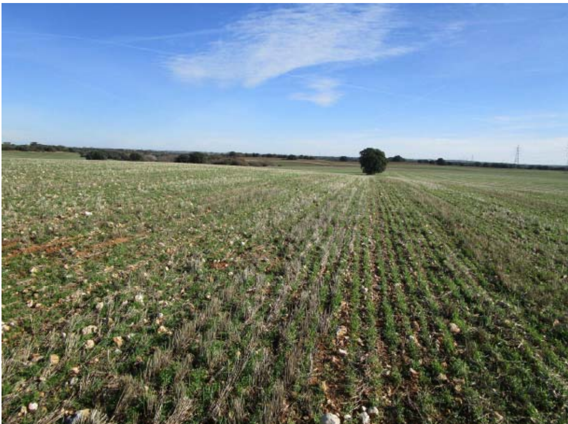
Panorámica del ámbito de la PSFV Quilla (6)