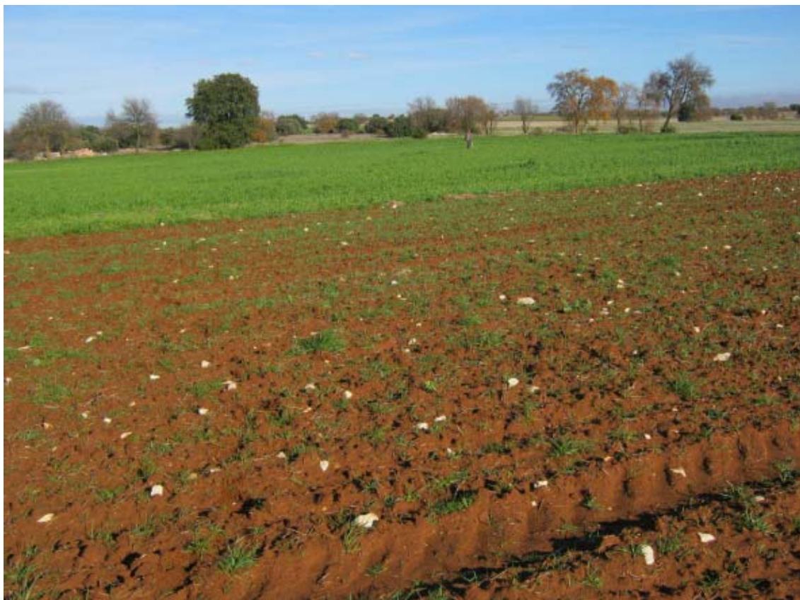
Panorámica del ámbito de la PSFV Portalón (5)