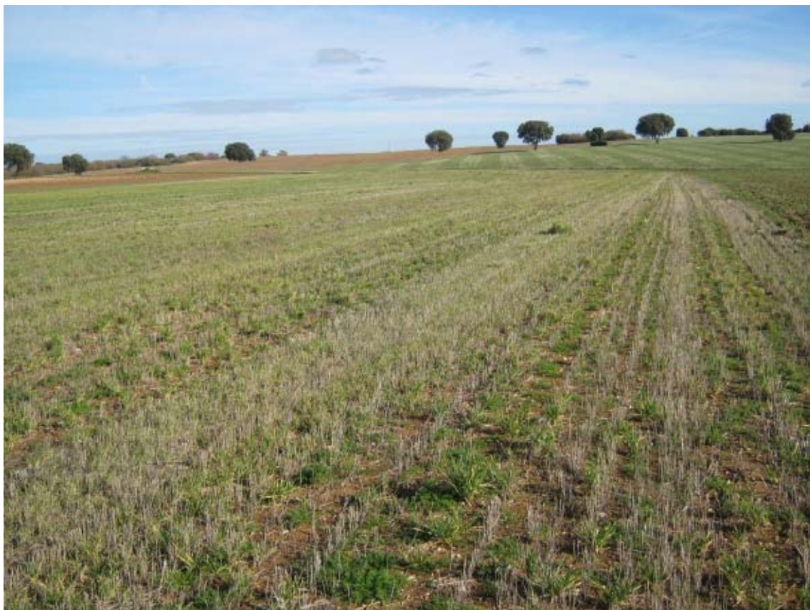
Panorámica del ámbito de la PSFV Quilla (1)