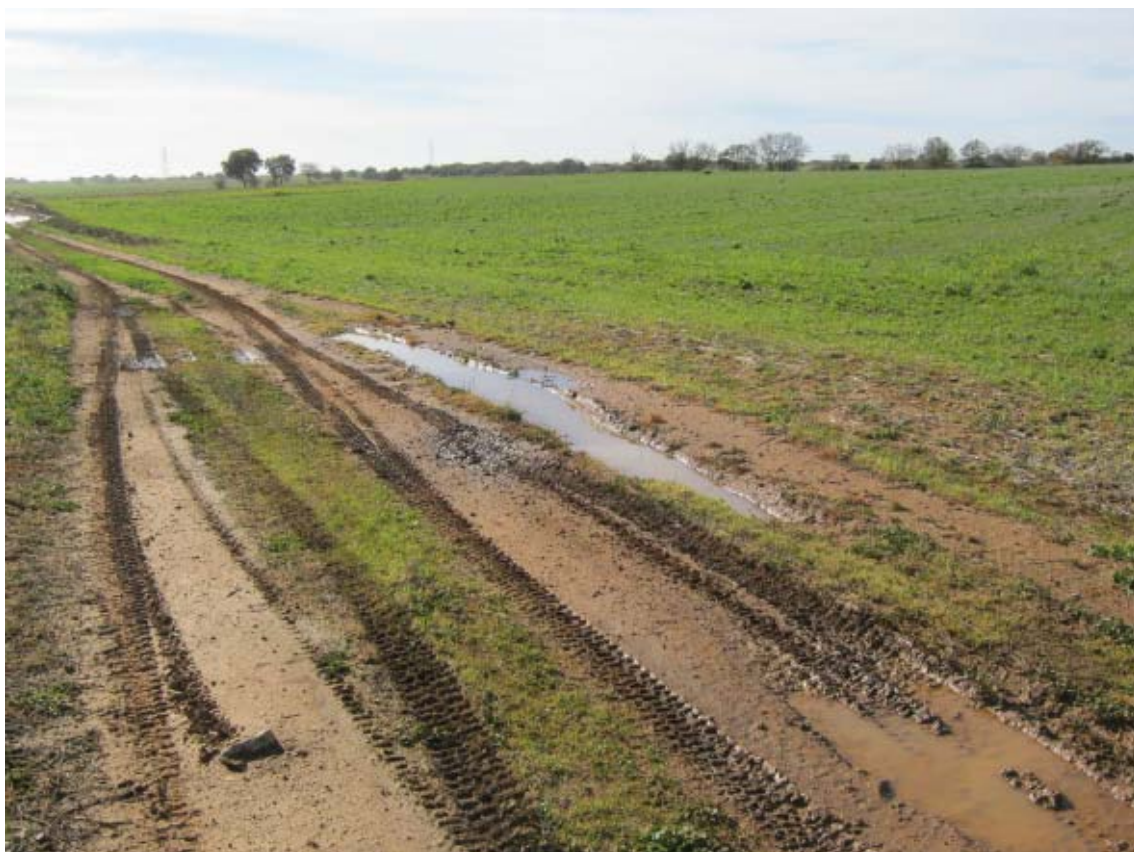
Panorámica del ámbito de la PSFV Quilla (2)