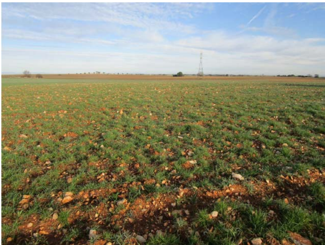
Panorámica del ámbito de la PSFV Spinnaker (1)