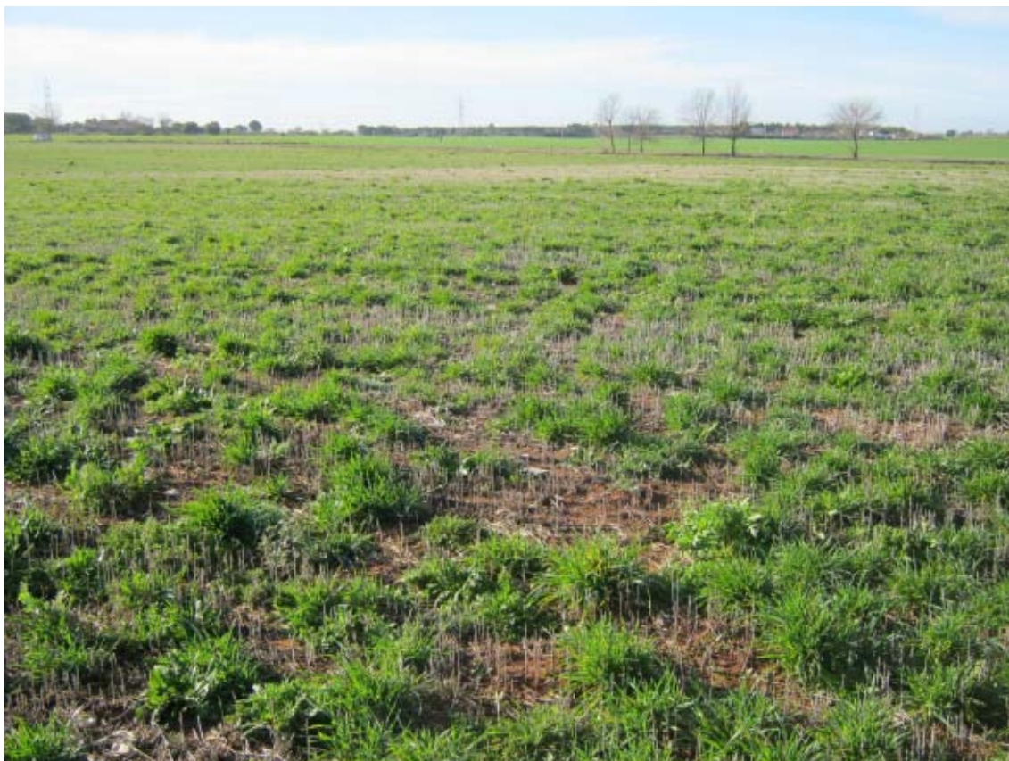
Panorámica del ámbito de la PSFV Portalón (4)