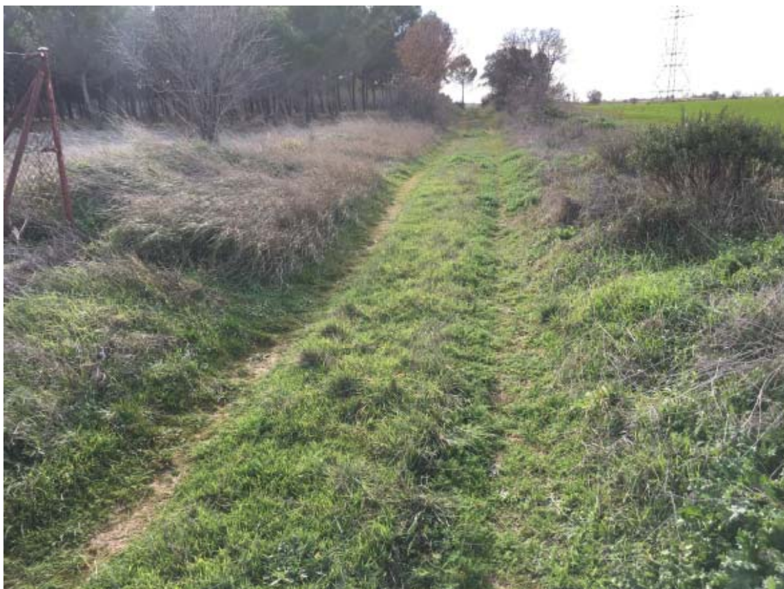
Vista general del área prospectada en líneas