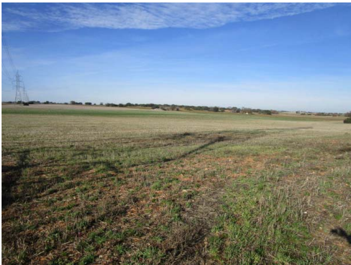
Panorámica del ámbito de la PSFV Quilla (5)