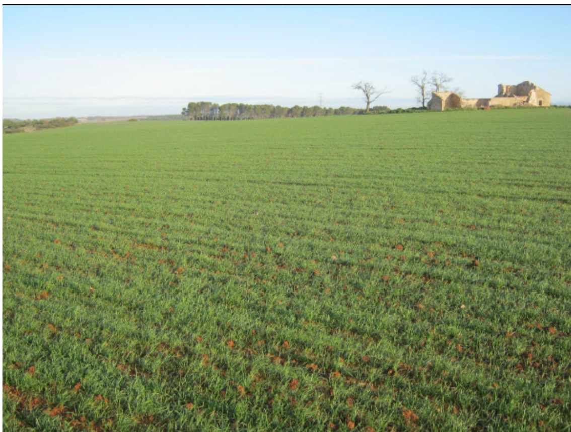
Panorámica del ámbito de la PSFV Portalón (1)