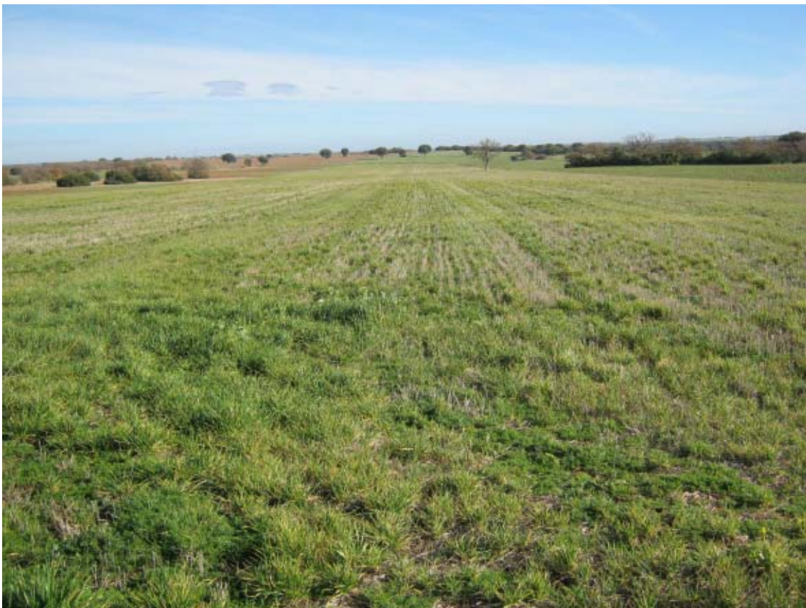
Panorámica del ámbito de la PSFV Quilla (4)