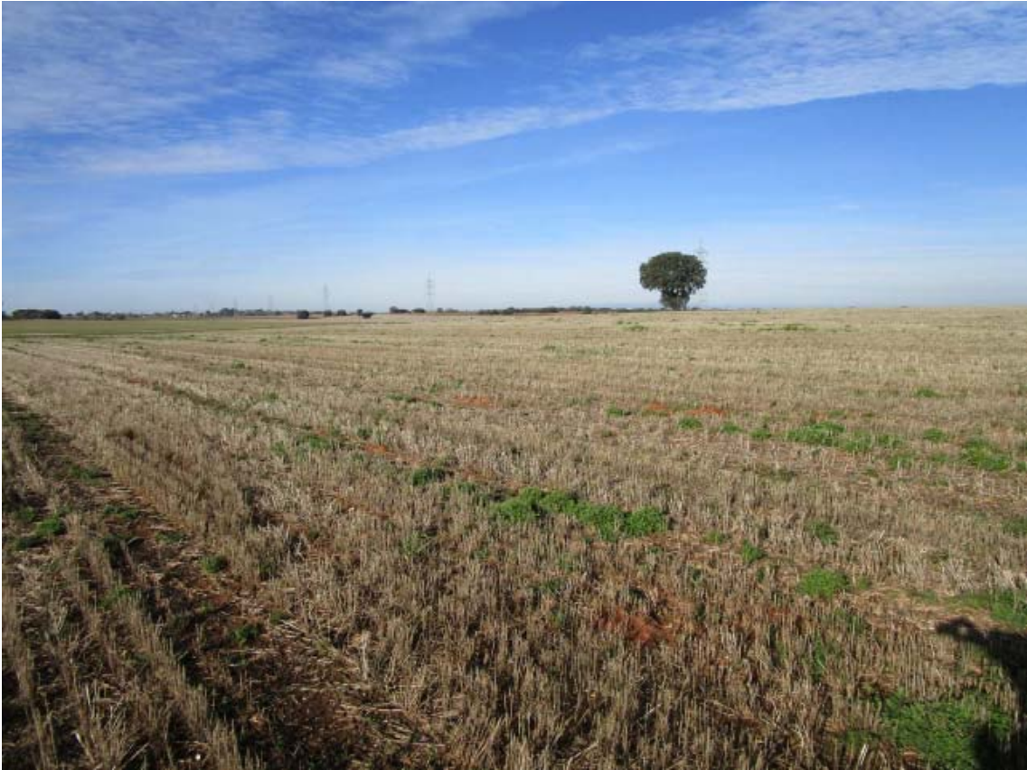
Panorámica del ámbito de la PSFV Quilla (8)