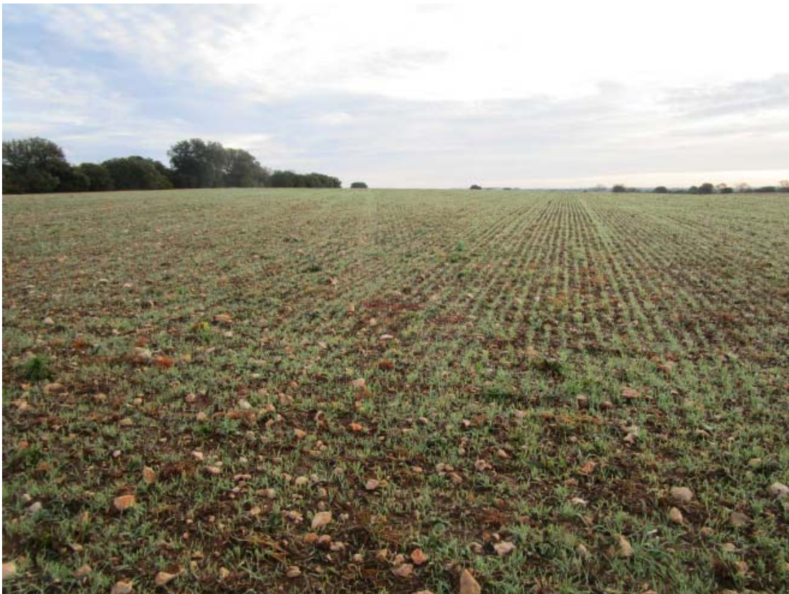
Panorámica del ámbito de la PSFV Spinnaker (4)