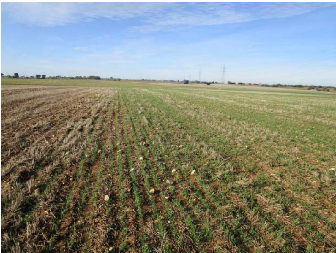
Panorámica del ámbito de la PSFV Quilla (7)