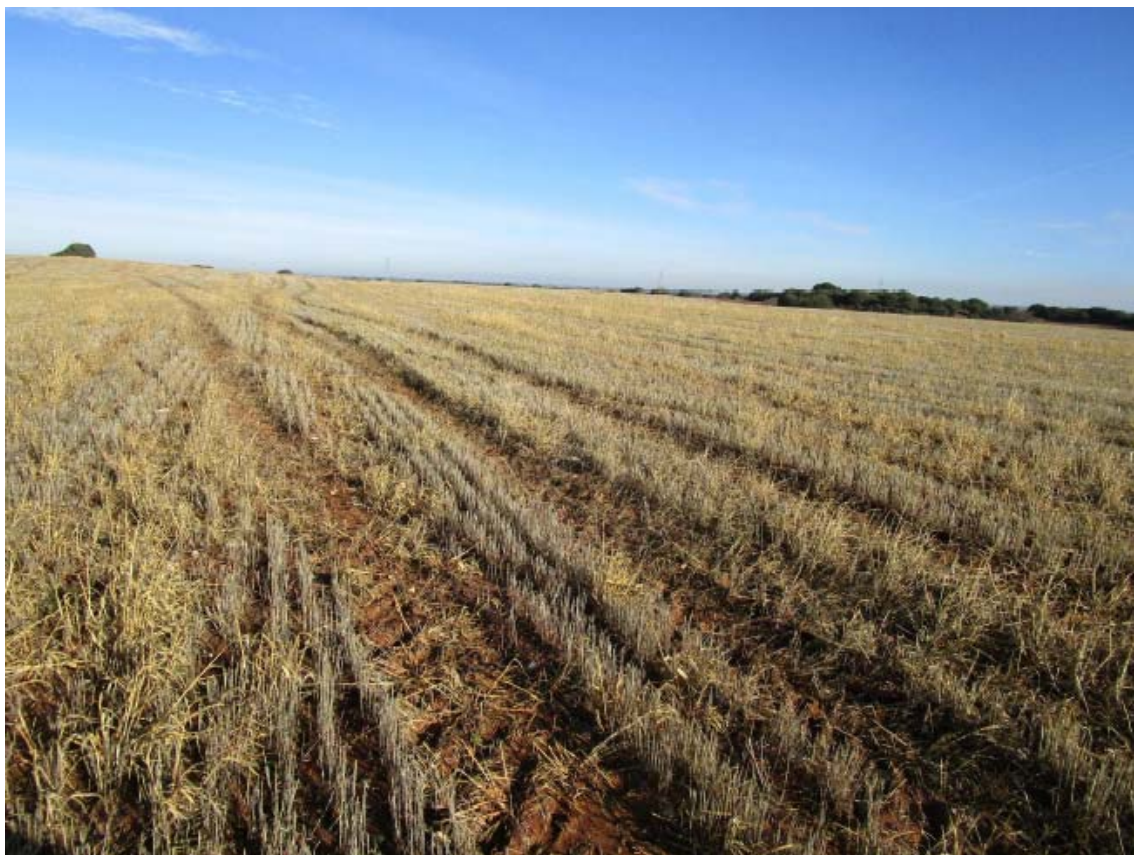
Panorámica del ámbito de la PSFV Spinnaker (3)