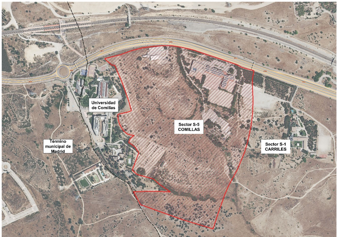
Figura. Delimitación del Sector S-5 "Comillas" sobre ortofoto (Google Maps)

La superficie total del ámbito de ordenación del Sector S-5 "Comillas", según levantamiento topográfico del terreno, es de 260.206 m 2 s. De esta superficie, 8.670 m 2 s corresponden a la superficie que ocupa el Dominio Público Hidráulico del arroyo Valdelacasa. Esta superficie de Dominio Público Hidráulico no computará a los efectos del cálculo de la edificabilidad ni generarán aprovechamiento, por lo que la superficie generadora de aprovechamiento es de 251.536 m 2 s.