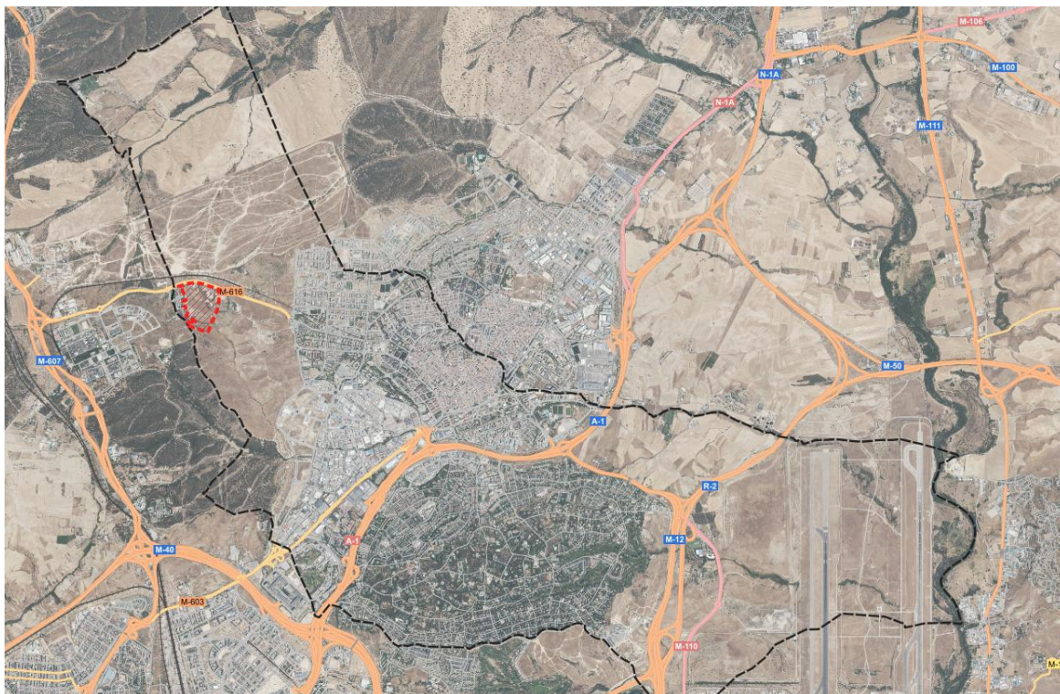
Figura. Ubicación del Sector S-5 “Comillas” sobre ortofoto (Google Maps)

El Sector S-5 “Comillas” está ubicado en el extremo Oeste del término municipal de Alcobendas, colindante con el término municipal de Madrid e incluido dentro de su área metropolitana. El Sector está atravesado por el arroyo Valdelacasa y tiene una superficie aproximada de 26 Has.