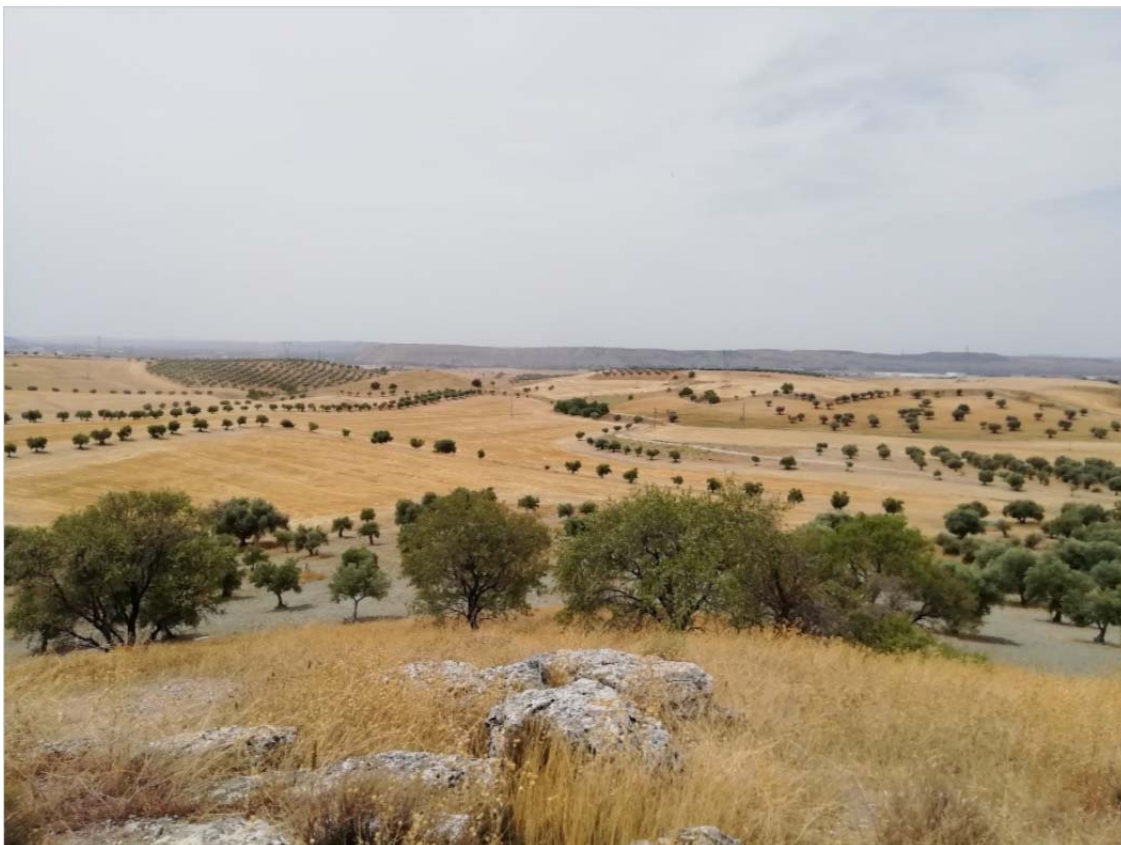
Vegetación en la PSFV SANABRIA SOLAR. Almendros en un cerro Al fondo, alternancia de cultivo herbáceo de secano y olivo.