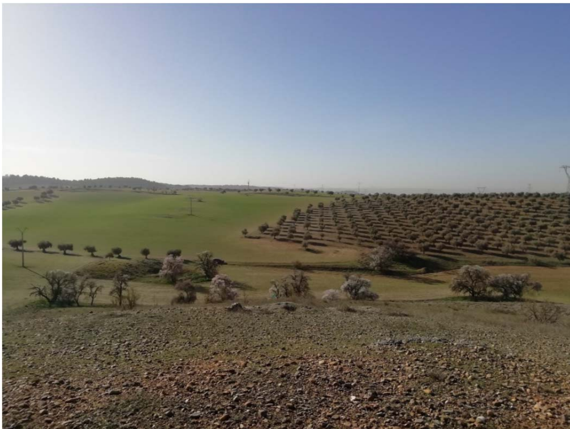
Vegetación en la PSFV VARADERO SOLAR. Tomada desde un cerro cubierto por vegetación herbácea y matorral.