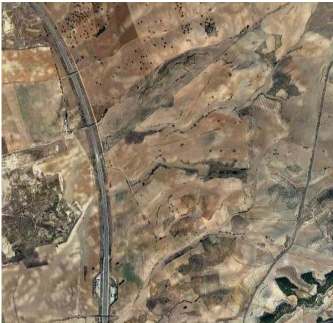
Ortofotografía de la ubicación de PSFV de Gallocanta Solar.