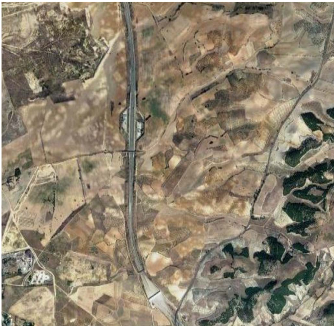
Ortofotografía de la ubicación de PSFV de Varadero Solar.