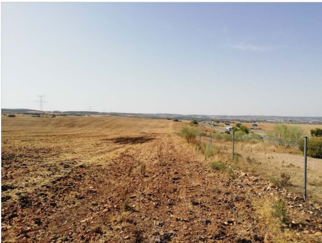
Vegetación en borde del camino en la PSFV GALLOCANTA SOLAR.