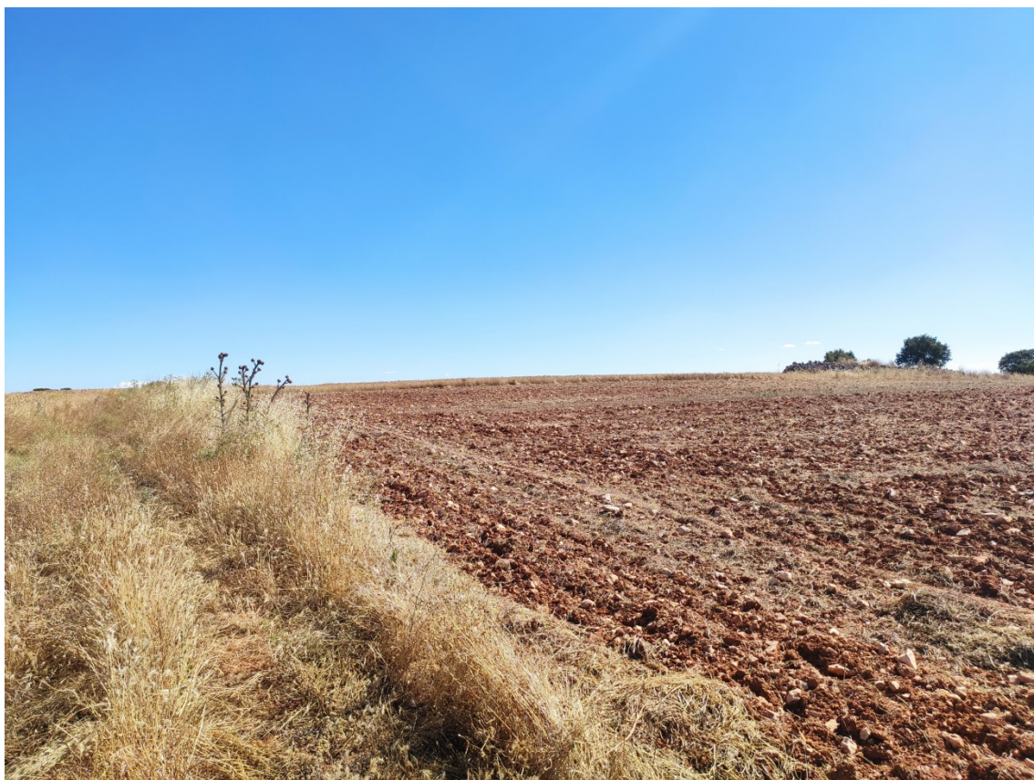
Panorámica del ámbito en el entorno del apoyo 45 de la Línea L220/kV