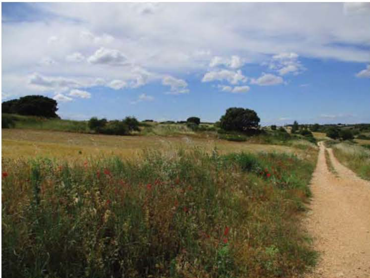
Panorámica del ámbito desde el Paraje los Villares hacia la PSFV