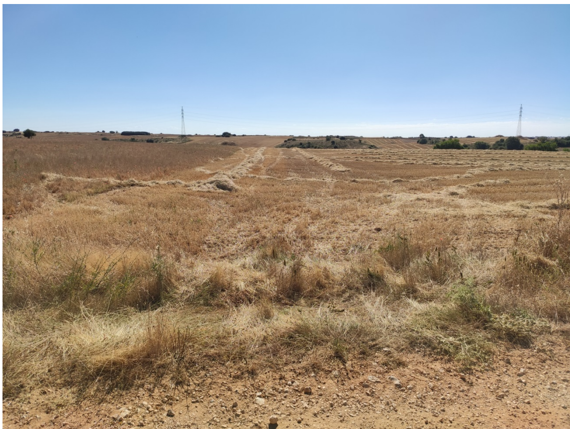
Panorámica del ámbito en el entorno del apoyo 43 de la Línea L/220 kV