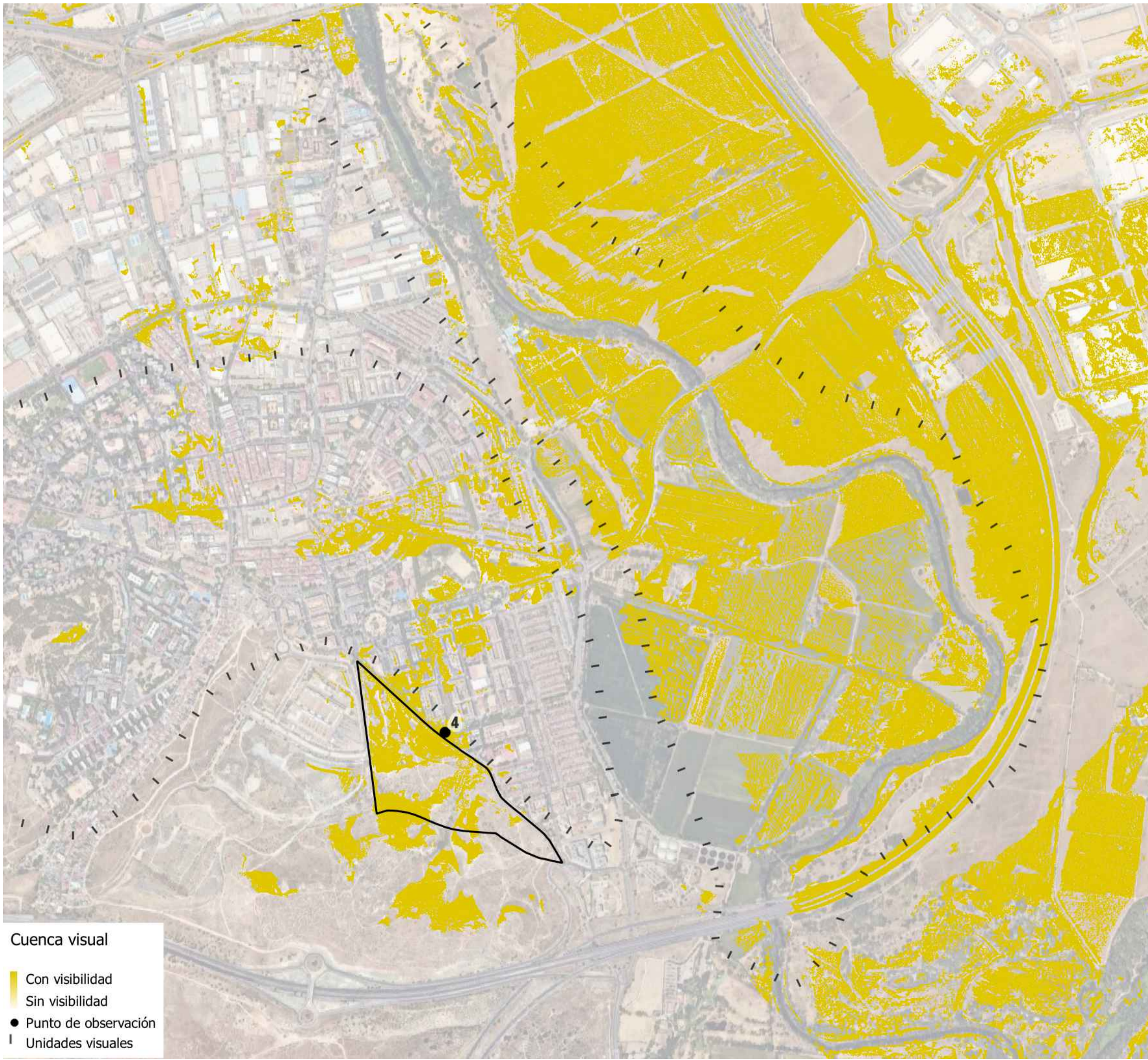
Punto de observación 4. Cuenca visual