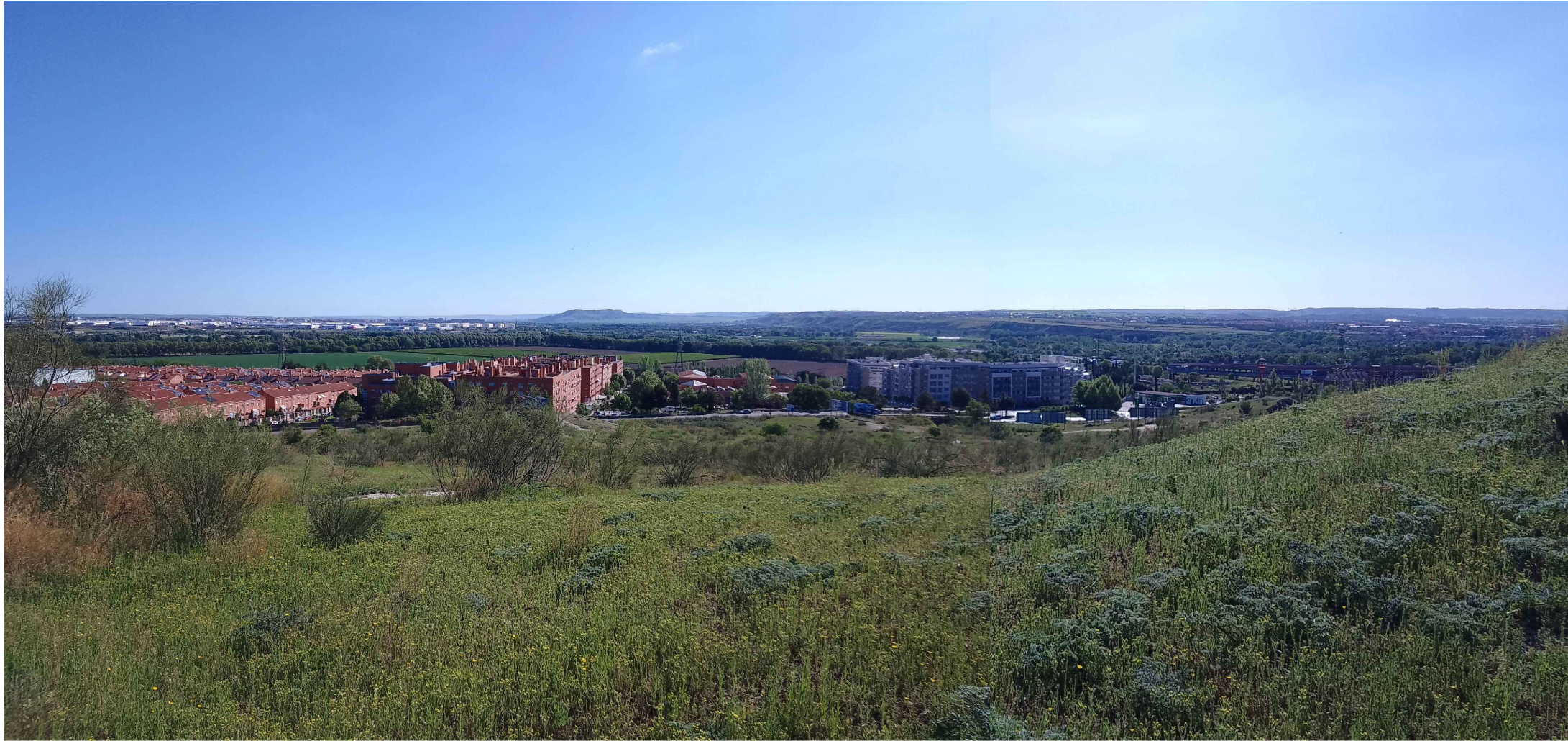
(V_3) Vista 3. Panorámica desde el suroeste