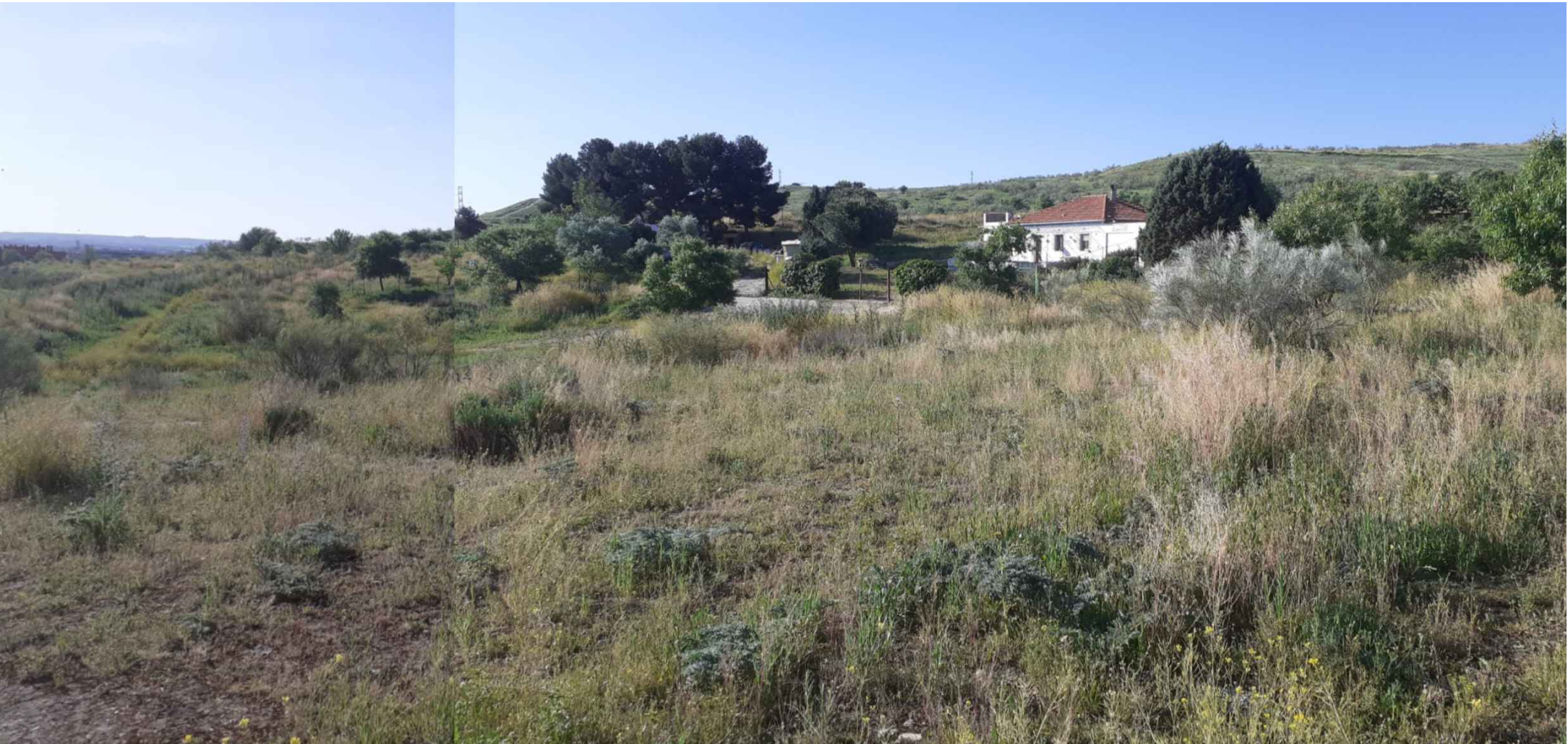
(V_8) Vista 8. Panorámica interior

Limite del ámbito UNS 04.05 "Desarrollo del Este - Ensanche de San Fernando"