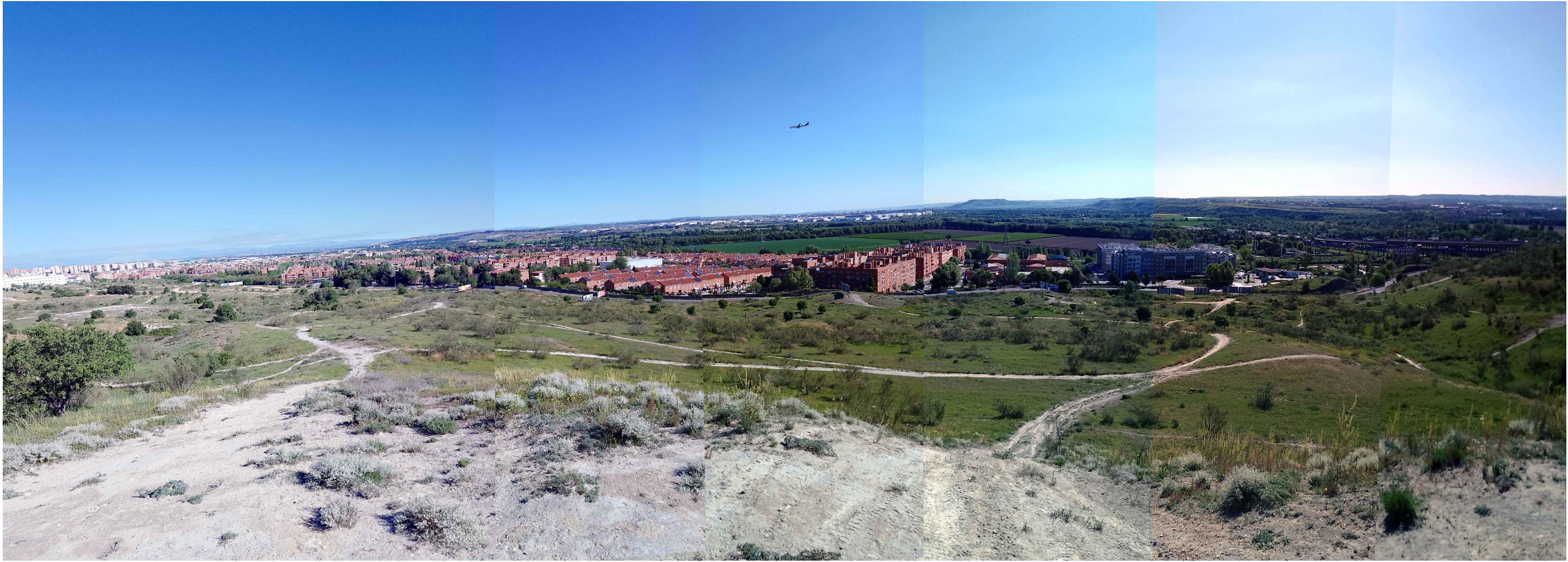
(V_1) Vista 1. Panorámica desde el sur