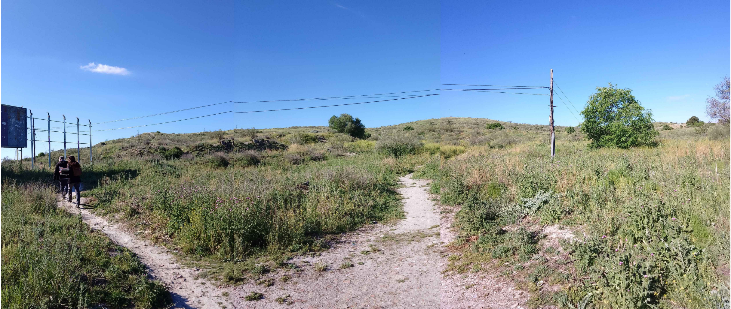
(V_4) Vista 4. Panorámica desde el sureste