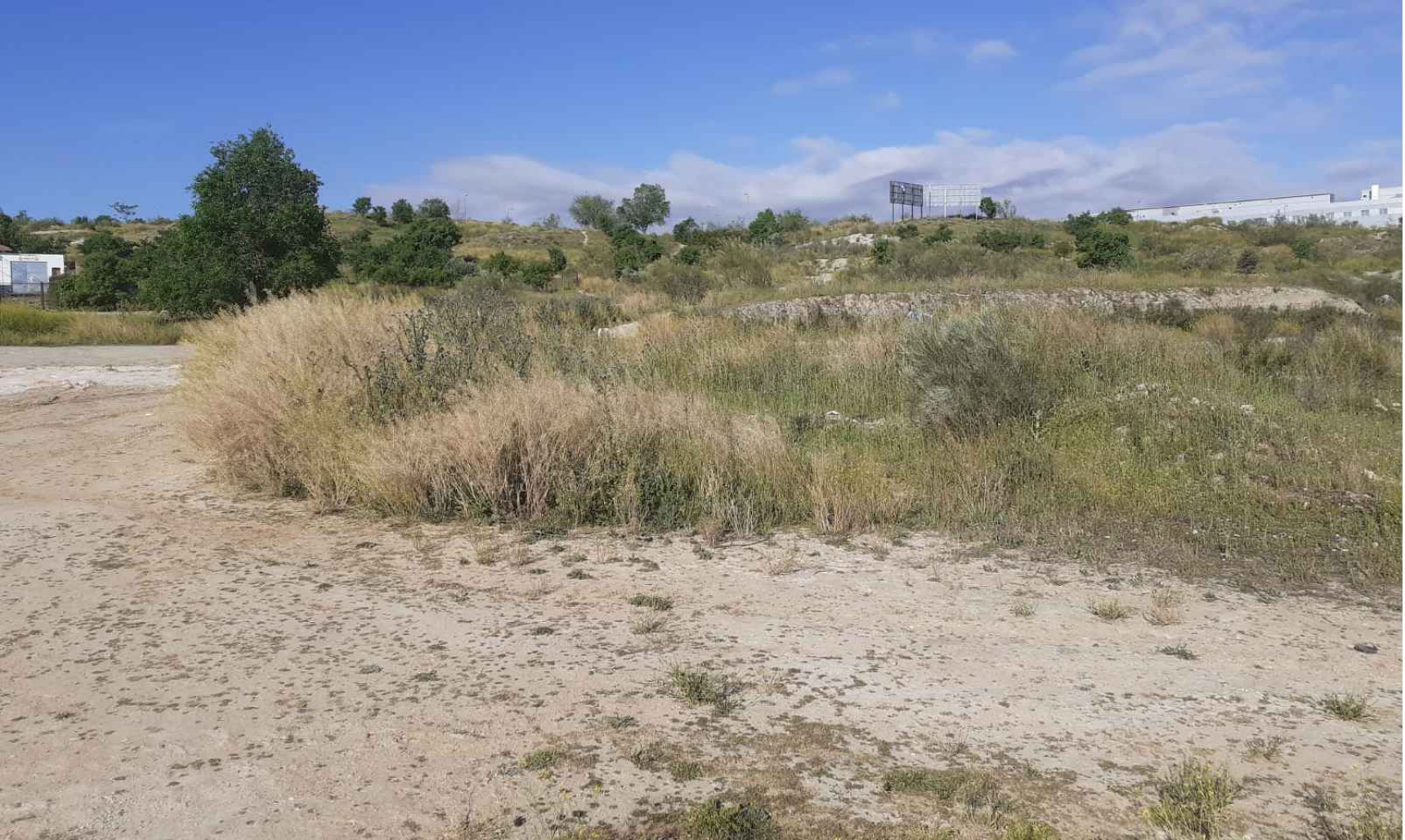
(V_6) Vista 6. Vista interior