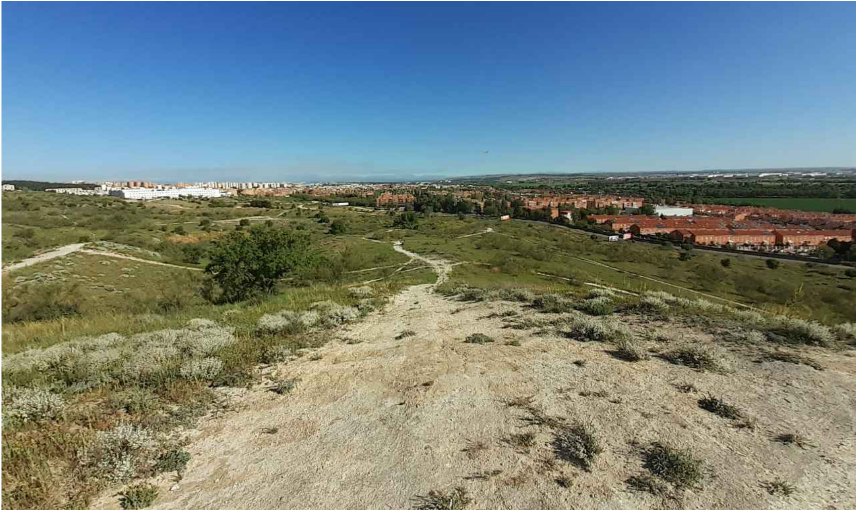
(V_2) Vista 2. Panorámica desde el sur