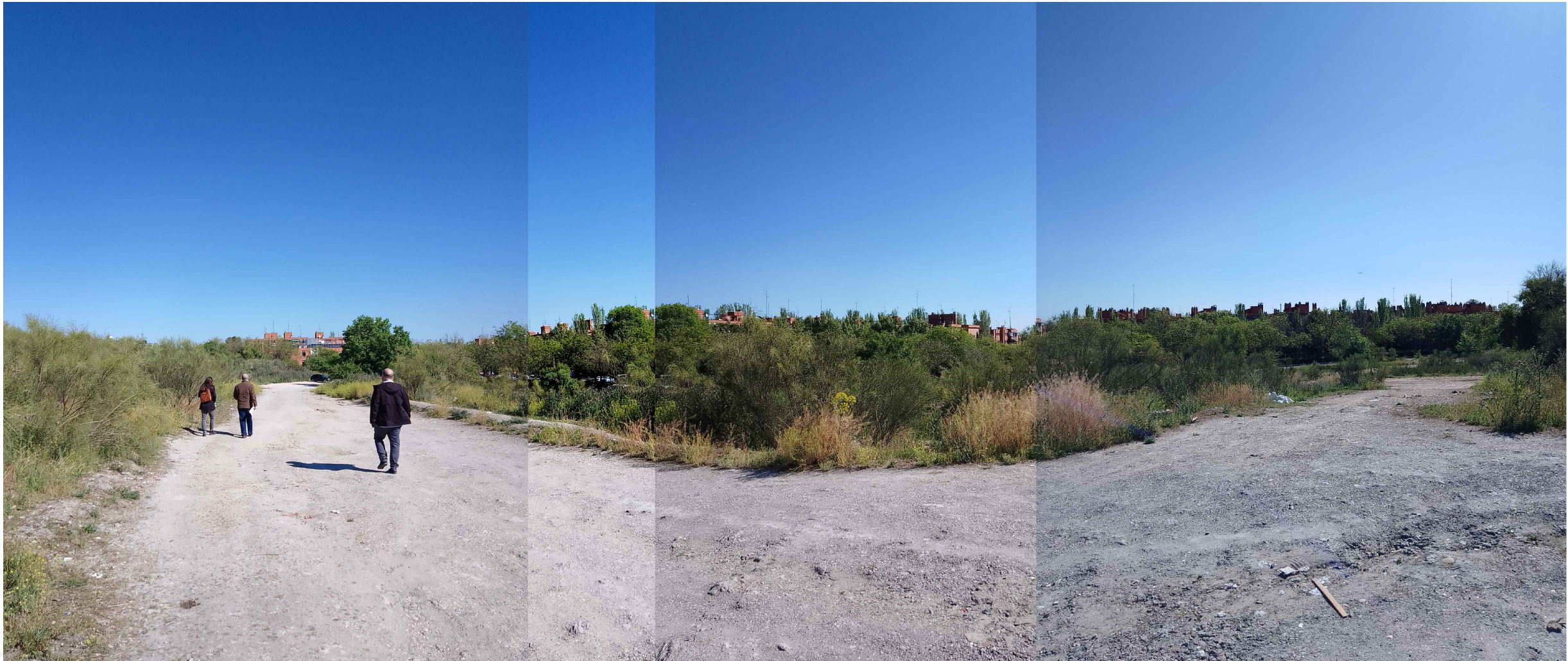
(V_7) Vista 7. Panorámica interior