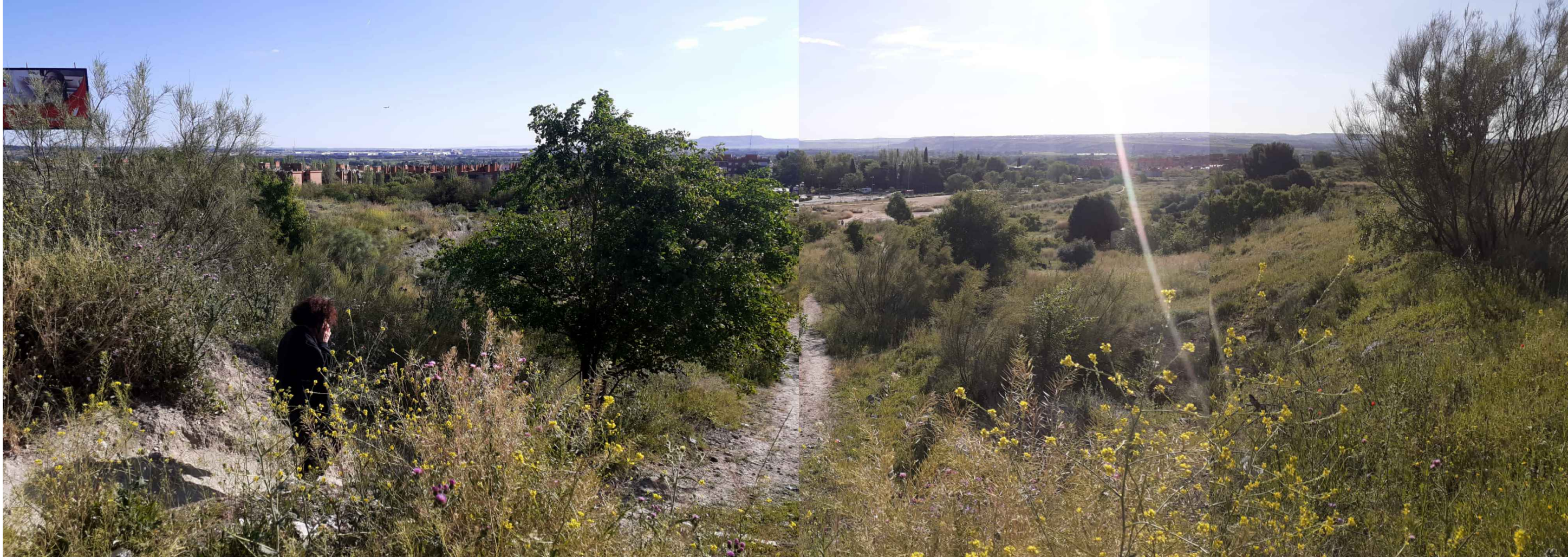
(V_5) Vista 5. Panorámica desde el oeste (Av. José Hierro)