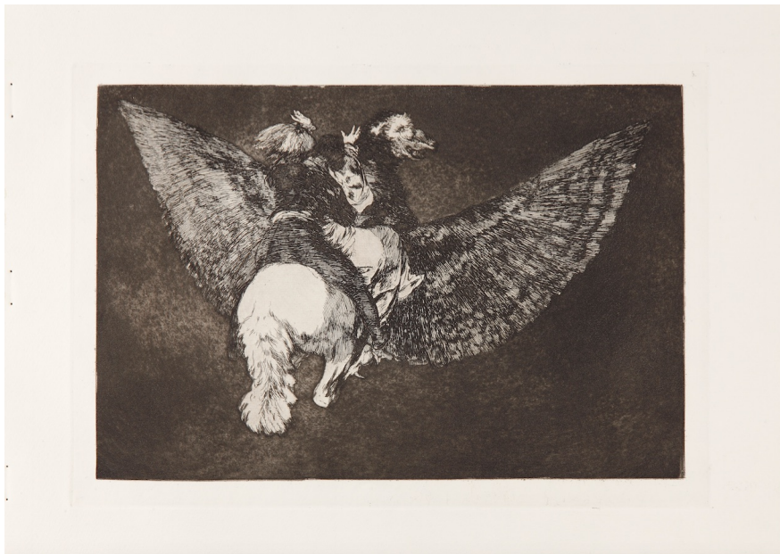
Disparate volante. Aguafuerte y aguatinta