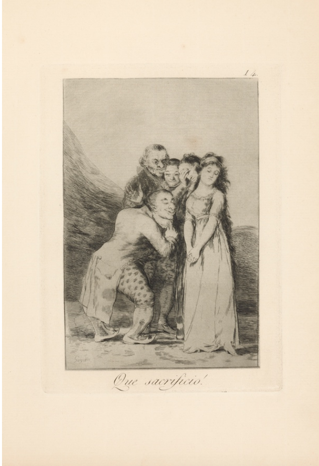
Capricho nº 14. ¡Que sacrificio!. Aguafuerte, aguatinta bruñida y punta seca

Los Caprichos son una serie de grabados realizados por Goya en los que hace una sátira de la sociedad española del siglo XVIII . En ellos ridiculizaba los vicios y censuraba la moralidad de la época.