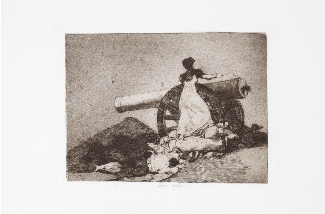
Desastre nº 7. ¡Qué valor! Aguafuerte, aguatinta, escoplo y bruñidor

En 1808 Francisco de Goya viaja a Zaragoza a petición del general Palafox para conocer y representar los sucesos de los sitios de Zaragoza durante la guerra de la Independencia española.