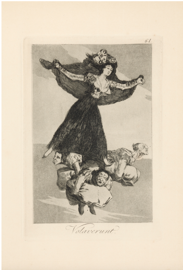
Capricho n.º 61. Volaverunt . Aguafuerte, aguatinta y punta seca

En algunos de estos grabados se ha querido ver a algún personaje concreto contemporáneo del pintor, como la duquesa de Alba, pero también a las mujeres de las clases populares de la época: las majas.