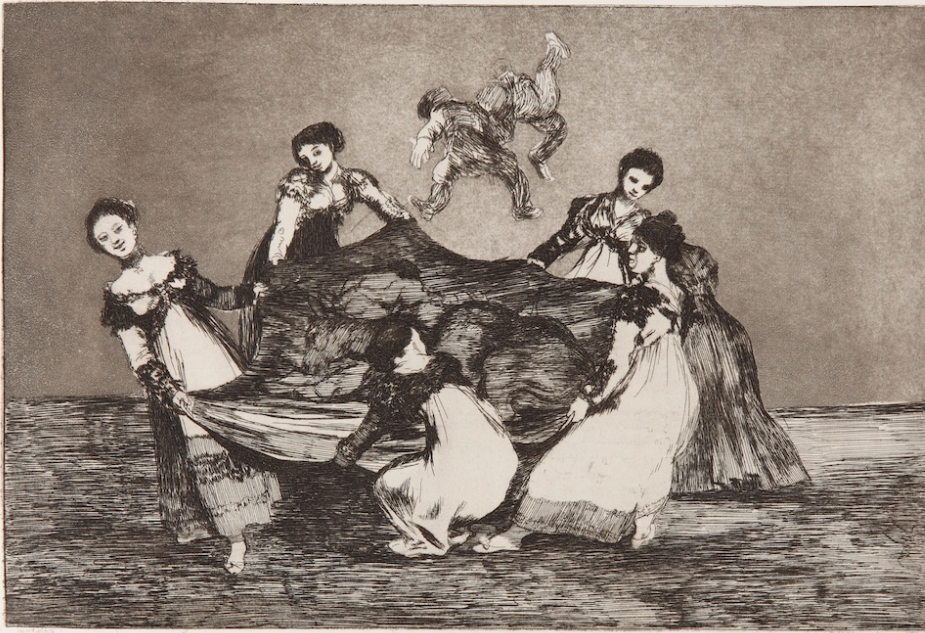
Disparate femenino. Aguafuerte, aguatinta y punta seca

Los Disparates, también conocidos como Los Proverbios, son una serie de grabados realizados por Francisco de Goya entre 1815 y 1824, justo antes de salir de España con dirección a Burdeos, donde residirá hasta su fallecimiento en 1828.