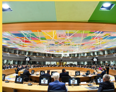
Sala de reuniones del Edificio Europa (Bruselas), sede del Consejo de la UE y del Consejo Europeo