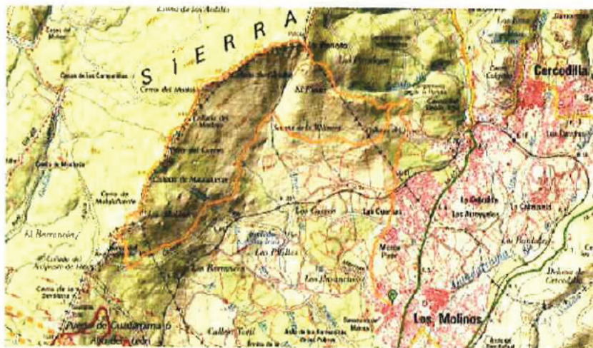
Localización del municipio de Los Molinos.