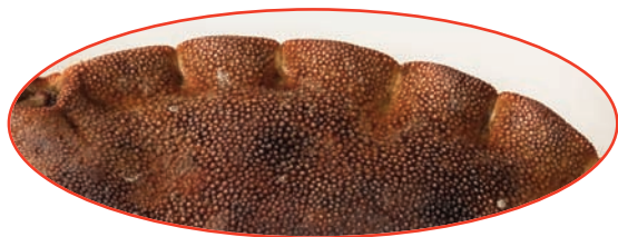
Bordes con diez lóbulos en cada lado

Cuerpo liso y ovalado, más ancho que largo.