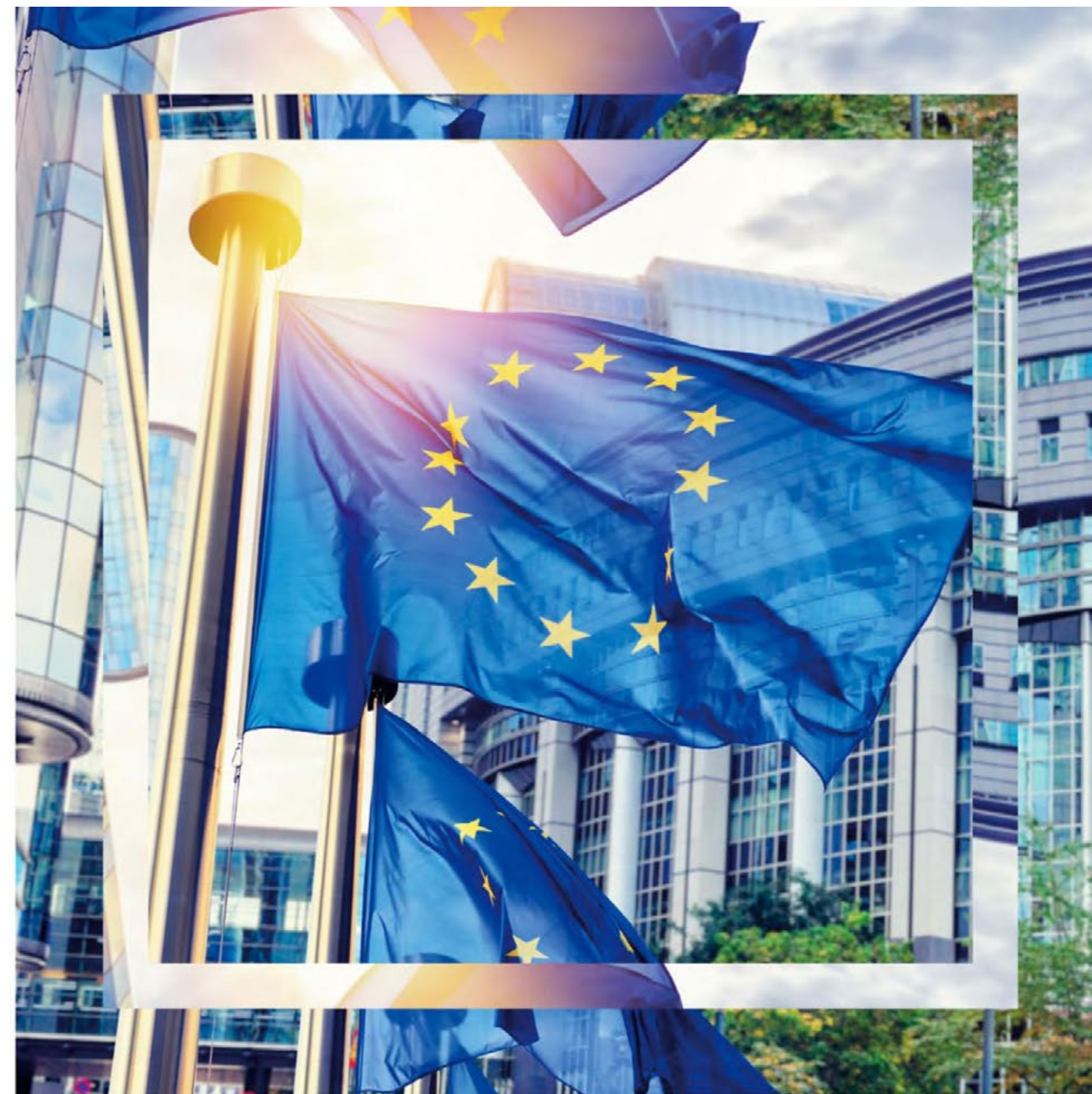
Las instituciones y organismos de la Unión Europea en Lectura Fácil