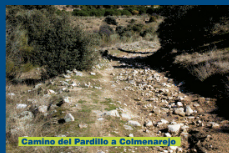
Camino del Pardillo a Colmenarejo

por la calle del Corzo, hasta la calle de la Perdiz, la primera que encontremos a la derecha, y que es bastante ancha. Continuamos por ella, entrando en el Polígono Industrial Fuente Conejo. A partir de esta glorieta nuestra ruta conecta con la nº 1 «Norte-Sur. De Collado Villalba a Serranillos del Valle», que viene de Collado Villalba y San Yago, y con la que coincidirá hasta el final de este recorrido, en Villanueva del Pardillo.