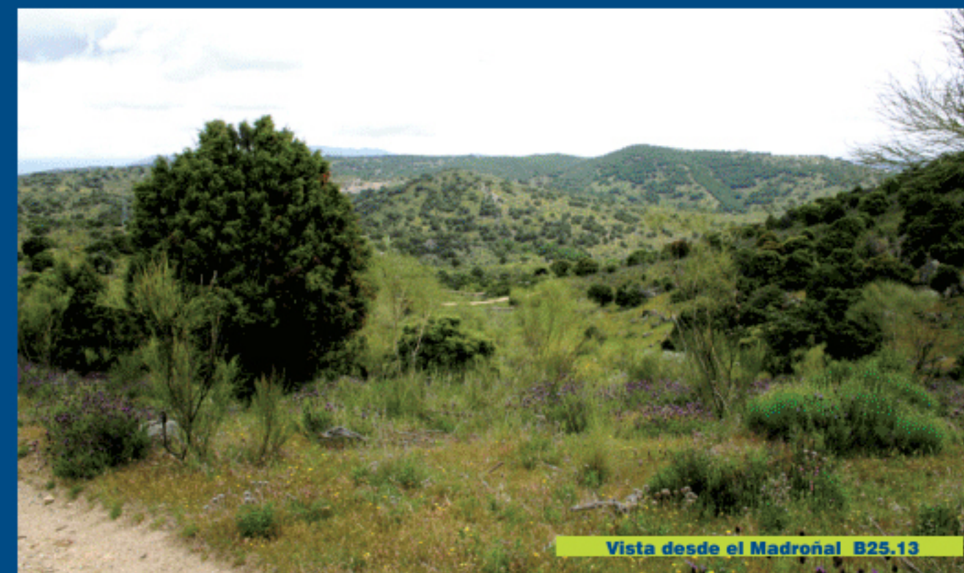
Vista desde el Madroal B23.13

El camino que seguimos, en dirección sureste, se vuelve estrecho en un tramo, junto a una tapia, para volver a ensancharse. Los seguiremos siempre de frente, ignorando un desvío que sale a la izquierda. Después de 1,3 kilómetros salimos de nuevo a un camino asfaltado, donde podríamos llegar también sin coger este tramo de camino, siempre por el camino asfaltado que dejamos atrás y luego por un desvío.