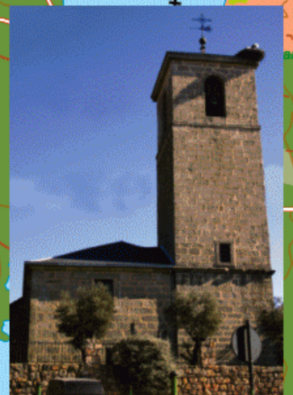
1 Colmenarejo Iglesia de Santiago Apóstol