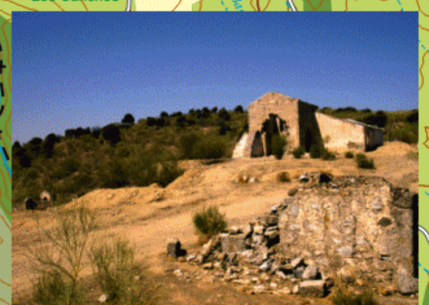
2 Restos de la zona minera