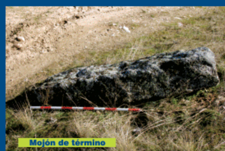
Mojón de término

Partimos de la iglesia de Santiago Apóstol, en Colmenarejo. Bajamos por la Carretera de Valdemorillo, en dirección sur (hacia Valdemorillo). Esta zona es una calle con aceras, por lo que no tendremos ningún problema con el tráfico. Seguimos la Carretera hasta llegar a una glorieta, donde giramos a la izquierda,