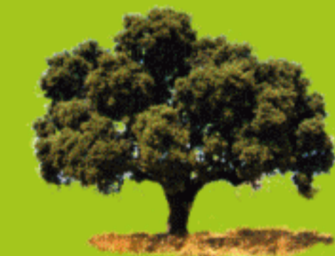
Encina ( Quercus ilex )