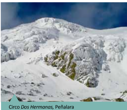
Circo Dos Hermanas, Peñalara

Con 2.428 metros el pico Peñalara es la cima del Parque Nacional y de la Sierra de Guadarrama. Da nombre al macizo montañoso que muestra la cara más alpina de esta sierra, con varios riscos, aristas, paredes verticales, fondos de circo, morrenas, lagunas, etc., que componen un paisaje muy singular modelado por el hielo. La ladera madrileña acoge al antiguo Parque Natural de la Cumbre, Circo y Lagunas de Peñalara, quizá uno de los espacios naturales protegidos más emblemáticos de la Comunidad de Madrid.