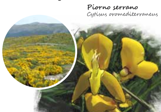
Piorno serrano Cytisus oromediterraneus

El piorno serrano ( Cytisus oromediterraneus ), apenas suele alcanzar el metro de altura, y se encuentra perfectamente adaptado al medio donde se desarrolla. La robustez y elasticidad de sus ramas, su tupido entramado de tallos y su aspecto acojinado, le permiten aguantar los fuertes vientos, la nieve y el frío. Los piornales protegen al suelo de la erosión y permiten que se desarrolle en su interior una intensa actividad biológica.