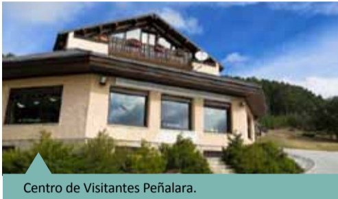
Centro de Visitantes Peñalara.

El Centro de Visitantes Peñalara es la puerta al macizo homónimo, algo más que un centro donde recibir información sobre los valores naturales y culturales de Peñalara y del resto del Parque Nacional, rutas, etc. Es además un lugar desde el que se organizan, controlan y canalizan las visitas para minimizar los impactos que ocasionan los miles de visitantes que recorren estas cumbres, donde los grupos organizados deben recoger una autorización para acceder al Macizo, así como informar sobre sus visitas. Además se ofrecen consejos, recomendaciones e indicaciones sobre la seguridad de esta zona de alta montaña, especialmente en la época invernal.