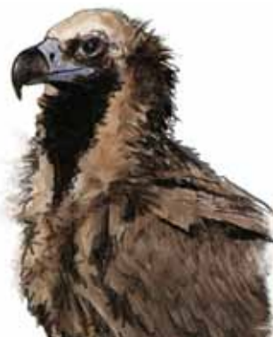
Buitre negro Aegypius monachus

Guadarrama es mucho más que un importante enclave natural. Hablar de este Parque Nacional es hacerlo de biodiversidad, de riqueza geológica y ambiental, de naturaleza salvaje y de cultura, historia y tradición.