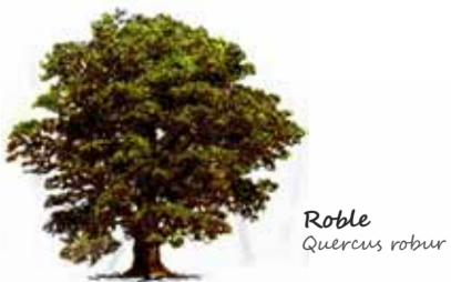
Roble Quercus robur

Aledaño al Centro de Visitantes, el Arboreto Giner de los Ríos cuenta con una muestra de alrededor de 200 especies arbóreas y arbustivas, de gran valor ornamental, etnobotánico y geobotánico de los bosques planocaducifolios de Europa, Asia y América.