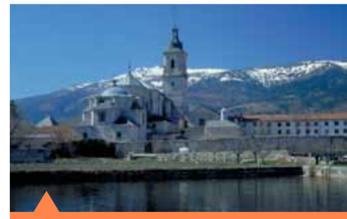
La Cartuja de El Paular

El Valle de El Paular es uno de los lugares más hermosos de la Comunidad de Madrid por su imponente naturaleza y la belleza de sus paisajes, sin duda fruto del uso que ha hecho el ser humano en este territorio. El hecho más sobresaliente fue la fundación de la Cartuja de El Paular en 1390, que con el tiempo, se convirtió en una verdadera potencia y en el motor económico de la comarca, con una cabaña ganadera muy importante y enormes posesiones.