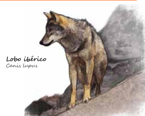
Lobo ibérico Canis lupus

Guadarrama es mucho más que un importante enclave natural. Hablar de este Parque Nacional es hacerlo de biodiversidad, de riqueza geológica y ambiental, de naturaleza salvaje y de cultura, historia y tradición.