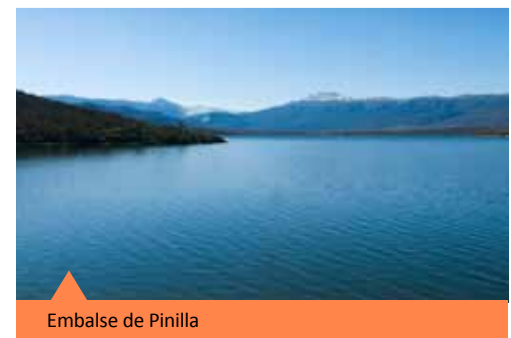
Embalse de Pinilla

El río Lozoya recoge las aguas de las Lagunas de Peñalara, atraviesa la sierra de oeste a este, y vierte sus aguas al río Jarama, tras formar 3 embalses: los de Pinilla, Riosequillo y Puentes Viejas. El embalse de Pinilla es el comienzo de una de las redes de abastecimiento de agua a Madrid Capital. La construcción del embalse en el río Lozoya fue un hecho de capital importancia en el valle pues, además de su repercusión en el paisaje y en el medio, que quedaron definitivamente transformados, supuso un periodo de actividad constructiva desconocida en la zona. Las aguas empezaron a embalsarse en febrero de 1967.