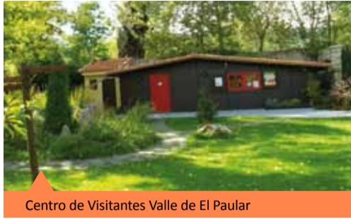
Centro de Visitantes Valle de El Paular

El Centro de Visitantes está situado frente al Monasterio de El Paular, en un enclave de gran relevancia histórica y no menos importancia natural.