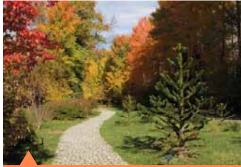
Arboreto Giner de los Ríos

Aledaño al Centro de Visitantes, el Arboreto Giner de los Ríos cuenta con una muestra de alrededor de 200 especies arbóreas y arbustivas, de gran valor ornamental, etnobotánico y geobotánico de los bosques planocaducifolios de Europa, Asia y América.