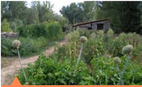
Área de Recursos Agroecológicos

El edificio principal, es de una sola planta en la que se localiza un aula multiusos y de atención al público. En el recinto exterior, el espacio cuenta con dos parcelas diferenciadas. Junto al edificio principal, se encuentra el Área de Recursos Agroecológicos que es un espacio demostrativo del manejo tradicional de los sistemas agroforestales de montaña. Está integrada por áreas de huertos, frutales, vivero, balcón comestible, jardín temático y elementos interpretativos de oficios tradicionales.