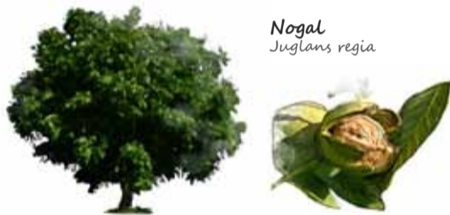
Nogal Juglans regia