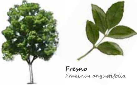
Fresno Fraxinus angustifolia