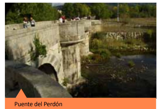
Puente del Perdón

Frente al Monasterio se alza, sobre las aguas del río Lozoya, el Puente del Perdón , una construcción de sillería de granito del siglo XIV; fue empleado por los monjes del Monasterio para salvar el curso del río y así acceder al molino de papel, situado al otro lado. Era el lugar donde según cuenta la leyenda, el reo, camino de la Casa de la Horca, podía apelar la sentencia por última vez.