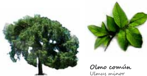
Olmo común Ulmus minor

Los ambientes forestales nos ofrecen la excelente posibilidad de observar una variada fauna forestal con grandes mamíferos, como el corzo ( Capreolus capreolus ), el jabalí ( Sus scrofa ) o la cabra montés ( Capra pyrenaica ). En ocasiones, se pueden divisar rapaces, como el buitre negro ( Aegypius monachus )