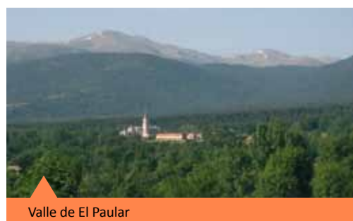
Valle de El Paular

El Parque Nacional ocupa 33.900 hectáreas de la Sierra de Guadarrama en el Sistema Central, macizo montañoso que divide en dos la meseta castellana y separa las cuencas hidrográficas del Duero y el Tajo y las provincias de Segovia y Madrid . A esta superficie se añaden otras 7.011 hectáreas como Área de Especial Protección en Valsain. La mayor parte de su superficie lo ocupan las cumbres, dominadas por los afloramientos rocosos y los pastos y matorrales de altura, siendo la cota más alta el Pico de Peñalara con 2.428 m.