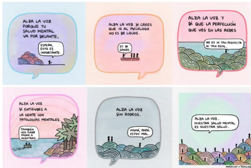
Ilustraciones – 72 kilos

V ENCUENTROS REGIONALES DE LA RED DE SERVICIOS DE INFORMACION JUVENIL 2022