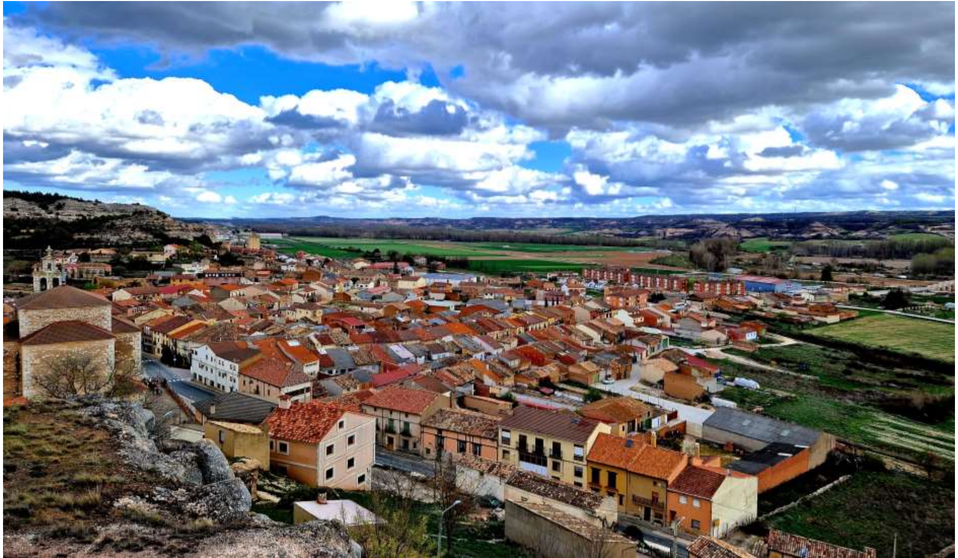
Langa de Duero (Soria)