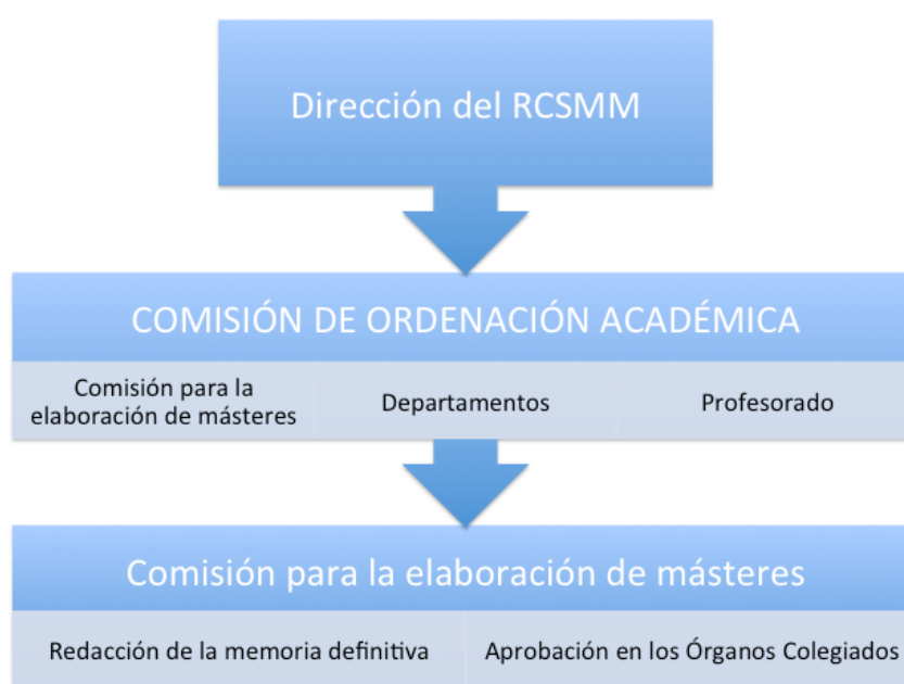
Gráfico 1 Organigrama de elaboración de la memoria del máster

Organigrama de elaboración de la memoria del máster: