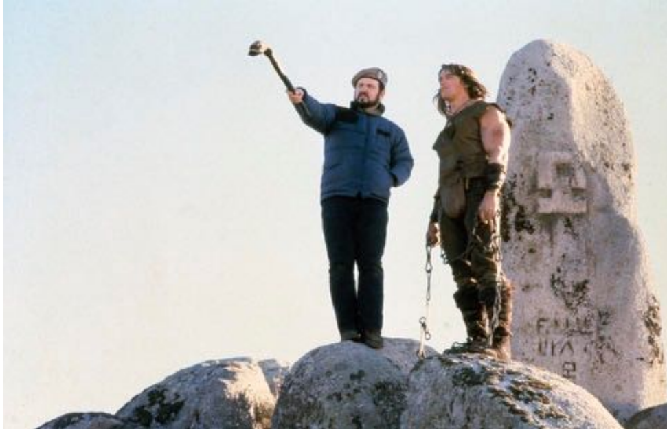
Arnold Schwarzenegger y John Milius en el rodaje de Conan el Bárbaro . Colmenar Viejo

La historia cuenta como un bárbaro llamado Conan, busca venganza por la muerte de sus padres a manos del líder de una secta que adora las serpientes. El protagonista fue interpretado por un desconocido hasta ese momento Arnold Schwarzenegger y dirigida por John Milius . El papel de Conan niño lo hizo el actor español Jorge Sanz .