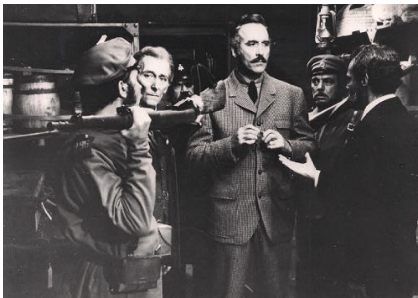
Pánico en el Transiberiano . Estudios Madrid 70. Daganzo

Pánico en el Transiberiano es una película de horror y ciencia ficción en la que se alternan actores ingleses como Christopher Lee y Peter Cushing , a quienes vemos en esta fotografía, con actores españoles como Silvia Tortosa o Julio Peña .