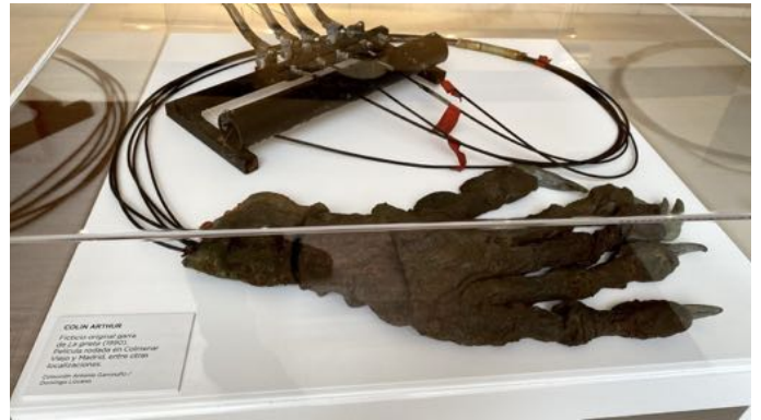
Garra de monstruo La grieta .

Supersonic Man fue la primera película española de superhéroes. Copiando algunos de los efectos especiales de La guerra de las galaxias , la escena de la nave espacial se realizó rodando esta maqueta sobre la que se iba abriendo el plano para dar la sensación de estar en el espacio.