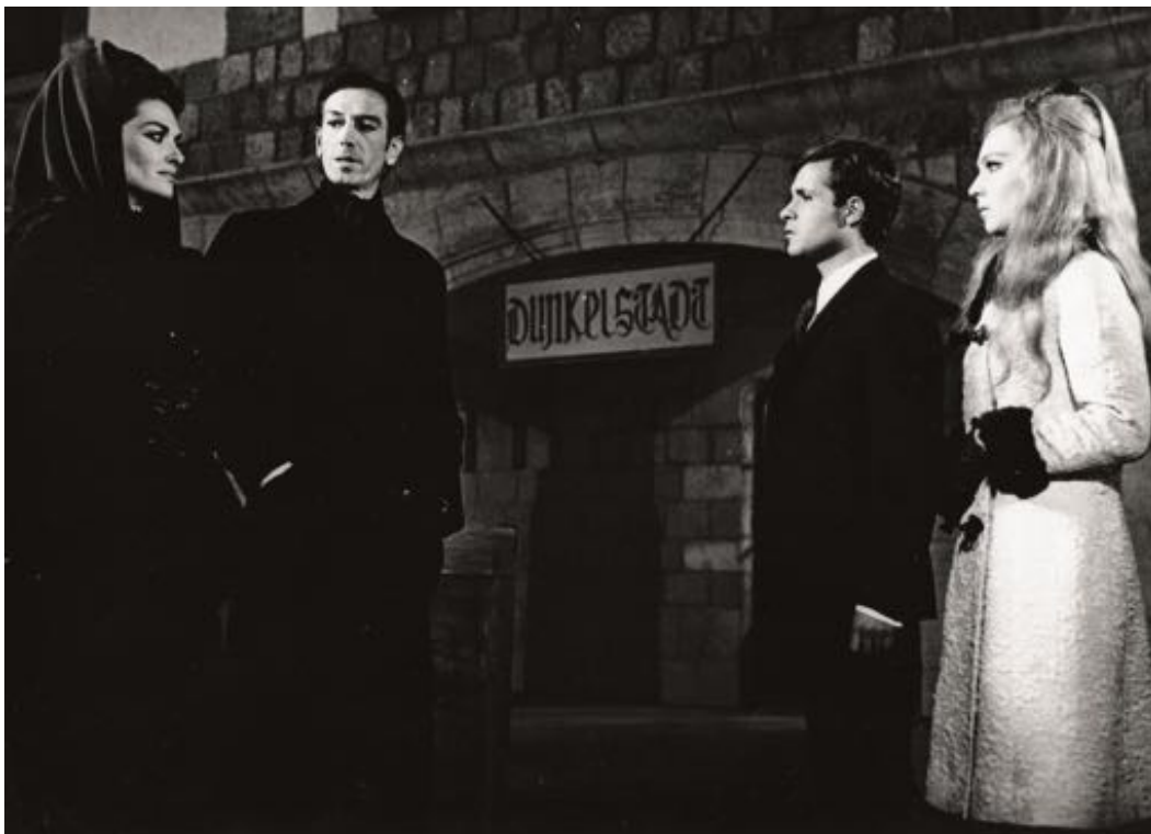
La marca del hombre lobo . Estación de Colmenar Viejo