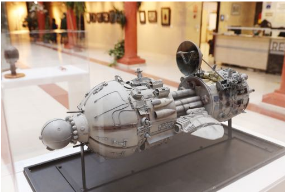
Maqueta nave espacial de Supersonic man . Emilio Ruiz del Rio.