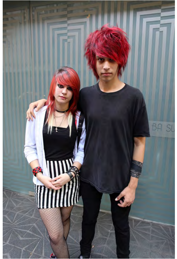
Pasarela Street. Buenos Aires, 2014 © Miguel Trillo, VEGAP, 2022.

La calle se convierte en un escaparate o una gran pasarela en la que estos jóvenes exhiben su forma de ser, su forma de vivir representado a través de su forma de vestir.