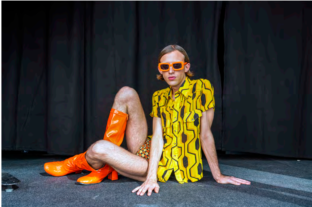
Pasarela Street. Madrid, 2018

Las fashion victims no salen a la calle de cualquier manera. Son personas creativas que a la hora de exhibirse eligen muy bien su vestuario. A Miguel Trillo siempre le llaman la atención por ser representantes de la modernidad.