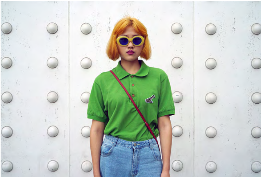
Pasarela Street. Shangai, 2017 © Miguel Trillo, VEGAP, 2022.