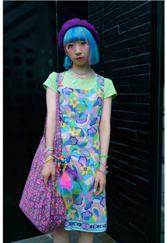
Pasarela Street. Tokio, 2017

La globalización es un fenómeno basado en el aumento continuo de la interconexión entre las diferentes partes del mundo.