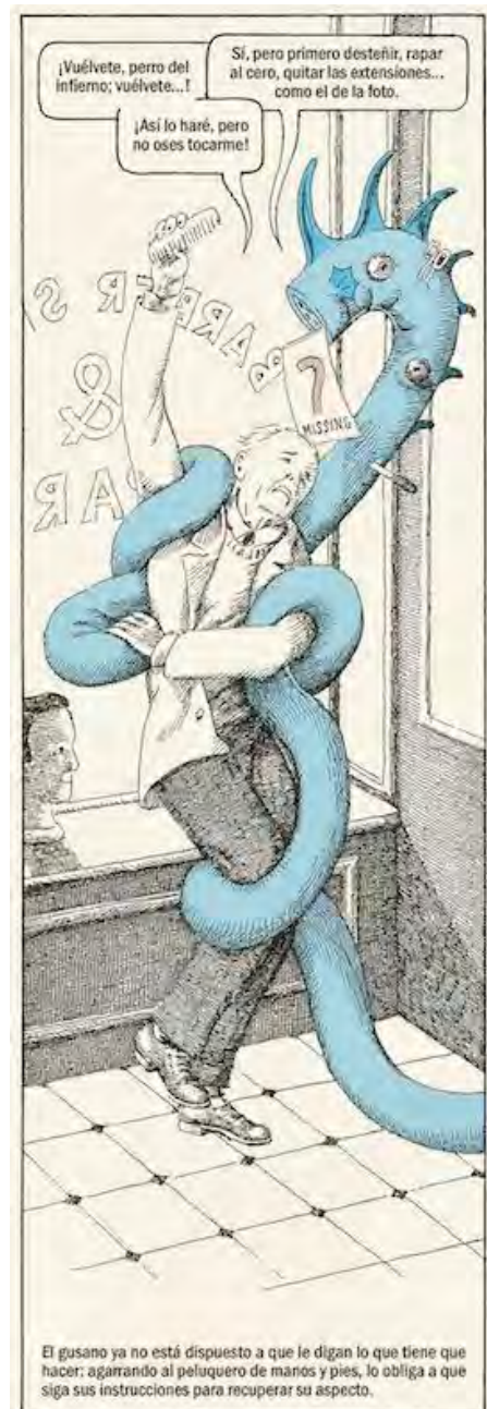
© Javier Sáez Castán. VEGAP. Madrid, 2024