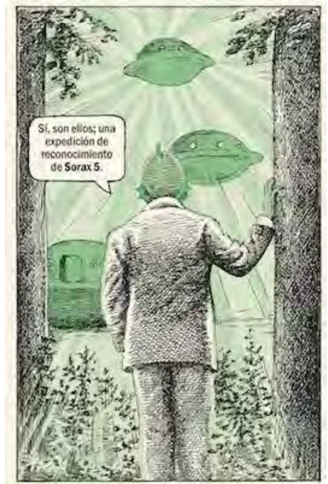
© Javier Sáez Castán. VEGAP. Madrid, 2024

Extraños es un homenaje y una parodia de las películas de serie B.