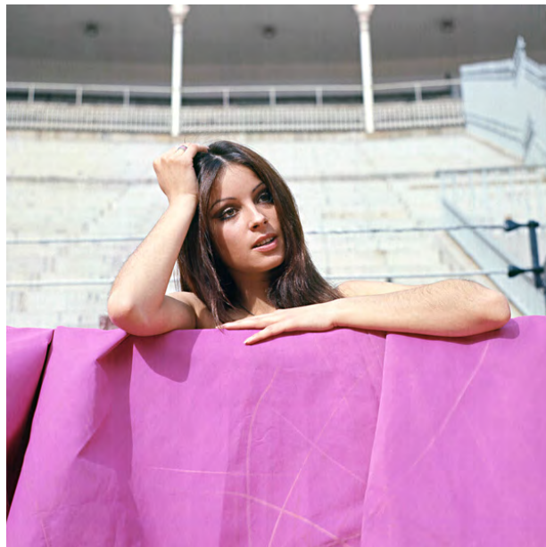
Amparo Muñoz, 1975

Amparo Muñoz fue una actriz y modelo malagueña, muy famosa por haber ganado el certamen de belleza Miss Universo 1974.