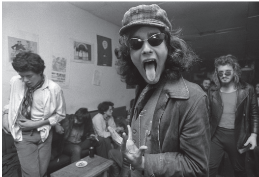
TRIBUS URBANAS: La Vaquera, en la calle Libertad, lugar de encuentro de progres, artistas, todos muy jóvenes, se dice, nació la Movida Madrileña. Madrid, 1976

BENITO ROMÁN. LA CONSTITUCIÓN VIVA LA DÉCADA PRODIGIOSA (1975-1985)