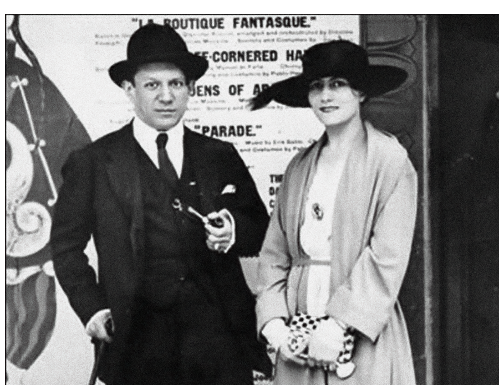
Anónimo, Pablo Picasso y Olga Khokhlova. ©Sucesión Pablo Picasso, VEGAP, Madrid, 2023 ©Fine Art Image / Heritage Images