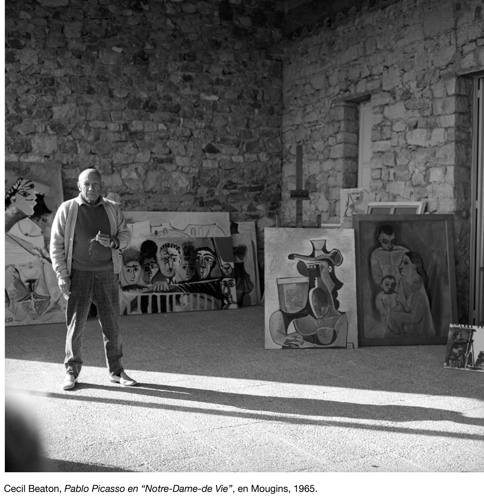
Cecil Beaton, Pablo Picasso en "Notre-Dame-de Vie", en Mougins, 1965. ©Sucesión Pablo Picasso, VEGAP, Madrid, 2023 ©Cecil Beaton Archive ©Condé Nast

Picasso no solo fue uno de los más fotografiados del siglo xx, sino, seguramente, una de las personas más carismáticas y fotogénicas de la historia. En el marco de las celebraciones con motivo del 2023-Año Picasso, la exposición Picasso por los grandes maestros. De Cecil Beaton a Irving Penn invitará, a través de 63 fotografías de maestros de la historia de la fotografía, a acercarse al artista, a sus formas de pensar y trabajar, y también a muchos momentos cruciales de su vida artística y personal en sus más de 70 años carrera. En la muestra están presentes instantáneas de grandes como Man Ray, Cecil Beaton, Robert Capa, Willy Rizzo, Gijon Mili, David Seymour, Michel Sima, David Douglas Duncan e Irving Penn. A cada uno, el genial y seductor español les daba algo diferente, "un momento decisivo", como decía Henri Cartier-Bresson.