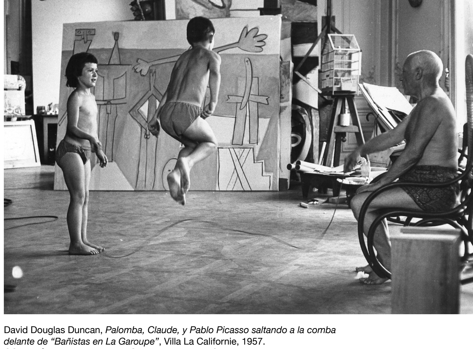
David Douglas Duncan, Palomba, Claude, y Pablo Picasso saltando a la comba delante de "Bañistas en La Garoupe", Villa La Californie, 1957. ©Sucesión Pablo Picasso, VEGAP, Madrid, 2023 ©David Douglas Duncan

Los grandes maestros de la fotografía del siglo xx tuvieron un papel decisivo en la construcción del mito Picasso, más allá del genio creativo, puramente artístico. Pablo Ruiz Picasso (Málaga, 1881-Mougins, 1973) encarnó el ideal del artista moderno, convirtiéndose en un icono universal de la cultura moderna con la complicidad de la fotografía. Conocía el poder de comunicación de este arte y comprendió muy pronto su importancia en la transformación de una imagen pública, así como su capacidad para alimentar el culto a la personalidad del artista.