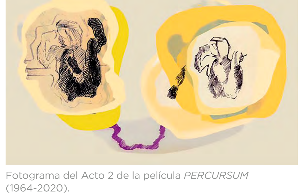
Fotograma del Acto 2 de la película PERCURSUM (1964-2020).