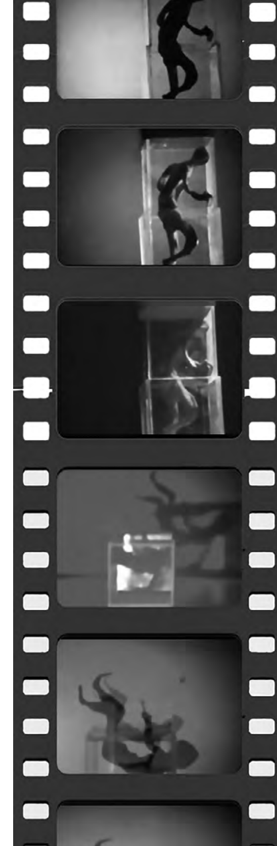
Correr, Girar, Caer (1964). Película super-8.