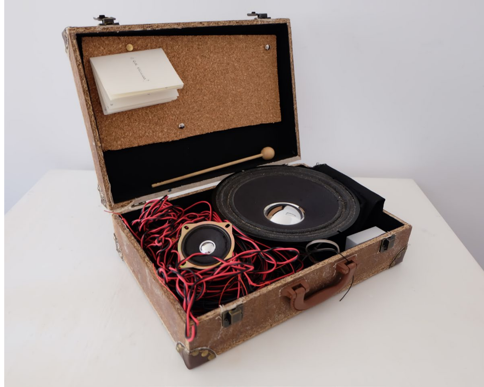
Fabiana Vinagre. Laboratorio de Transducciones. Instalación con sonidos captados de objetos y moldes de escayola, 2021.

La Avenida de América —donde está ubicada la Sala de Arte Joven — es un nudo del que tradicionalmente salen y llegan líneas de transporte desde todo el territorio. En este sentido es un punto de llegada y de fuga, un intercambiador de trayectorias. Durante meses este entramado ha permanecido mudo, muchas de sus tramas se han deshecho y caído inertes al suelo. La imagen de ese intercambiador como nudo desarticulado, como espacio vacío y paralizado, es análoga al vacío y el vértigo al que nos enfrentamos en nuestra convivencia con el virus.