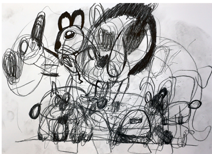
Alberto Bustillo, 2019

Aparecen varios animales o personajes en los que lo que más destaca son los ojos. Quizás te recuerden a personajes de dibujos animados.