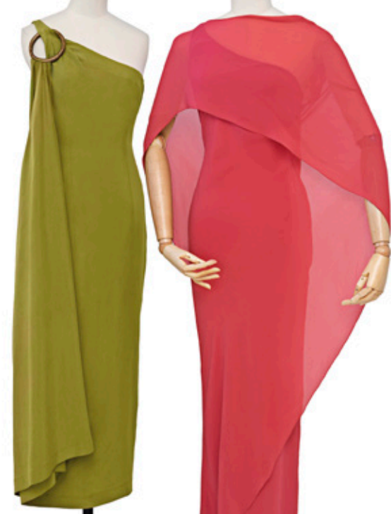
© Jaime Gorospe, 2022. Vestido. Etiqueta: Sybilla por Gibó. SS 1991 Vestido. Etiqueta: Sybilla. SS 2015 Colección Sara Ball. Colección particular.

Las tres primeras secciones, que engloban las piezas de indumentaria, entre las que se encuentran sus vestidos más icónicos, nos presentarán esos códigos que acompañan a Sybilla a lo largo de su trayectoria. La cuarta sección, El Hilo del Tiempo, nos desvela a través de diversos documentos, la fascinante trayectoria de esta diseñadora. Por último, Un Hilo de Voz, un vídeo íntimo que ahonda en su universo creativo.