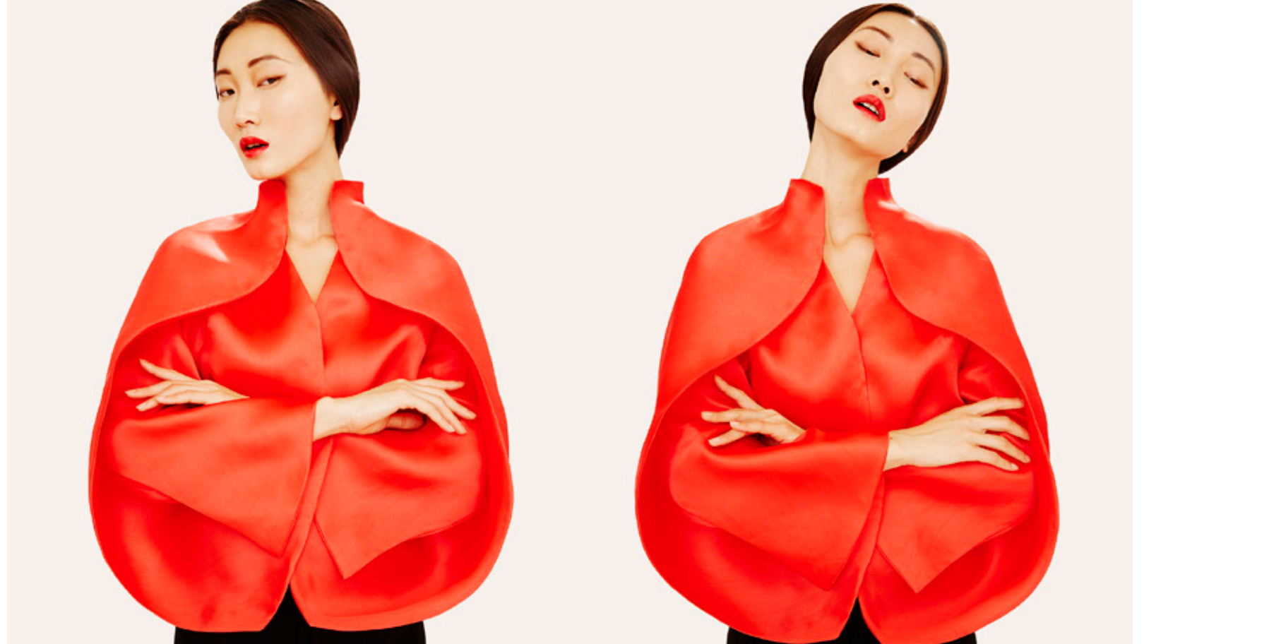
© Félix Valiente, 2015. Camisa colección otoño-invierno 2015/2016.

Sybilla Sorondo Mielżyńska (1963), aunque nace en Nueva York y es hija de padre argentino y madre polaca, se considera española, madrileña y mallorquina de adopción. El talento y la genialidad que posee para el diseño son de los que aparecen excepcionalmente de tanto en tanto; no en vano, la crítica nacional e internacional la considera la principal diseñadora que ha dado la moda española desde Cristóbal Balenciaga, y le han sido otorgados reconocimientos como el Premio Balenciaga, el Premio Nacional de Diseño y la Medalla de Oro al Mérito de las Bellas Artes, entre tantos otros.