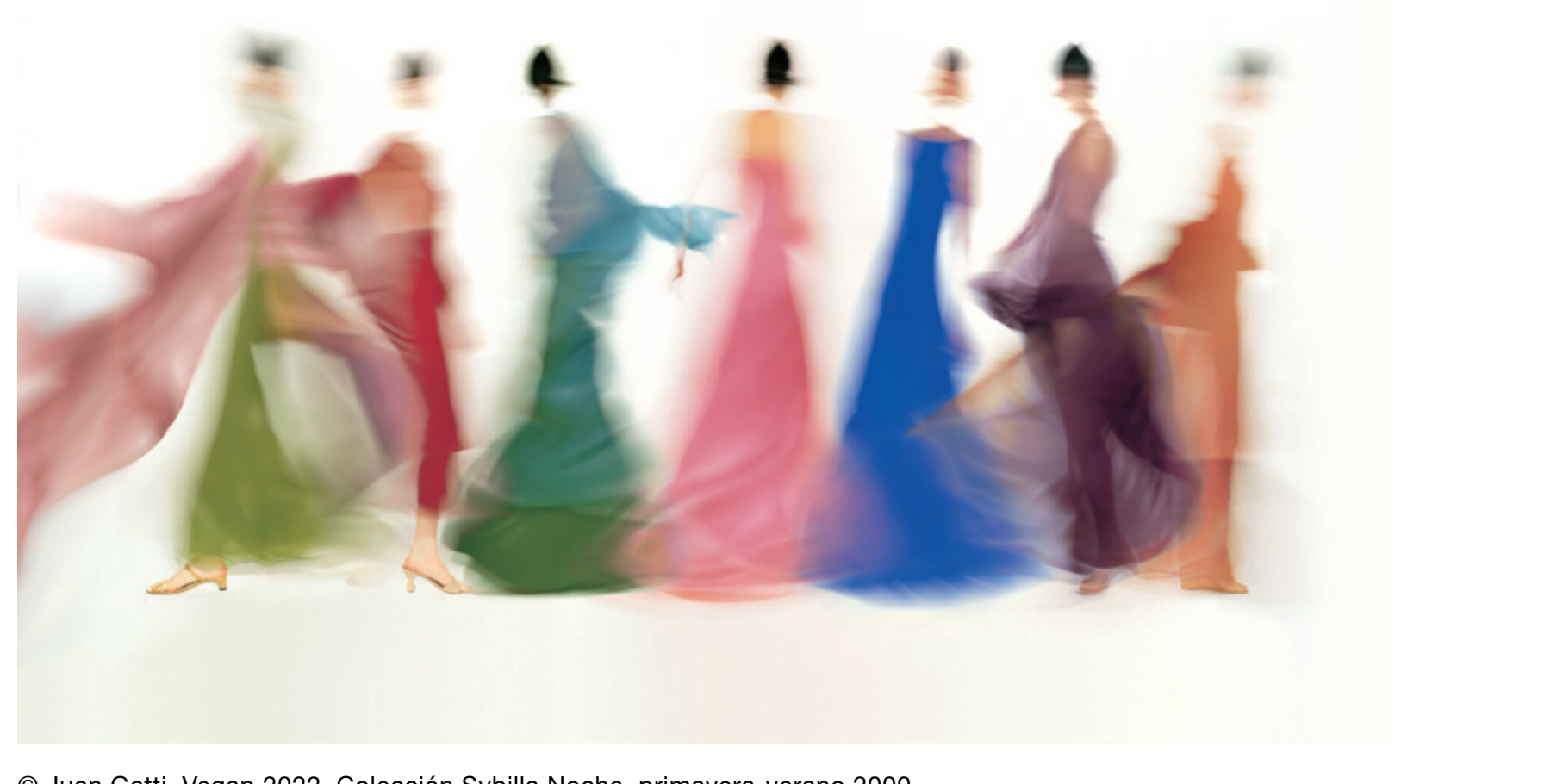
© Juan Gatti, Vegap 2022. Colección Sybilla Noche, primavera-verano 2000.

Vista en conjunto, podría no parecer fácil encontrar un hilo conductor en su obra, sin embargo, ese hilo existe y está presente en forma de lenguajes que dan coherencia a su trabajo.