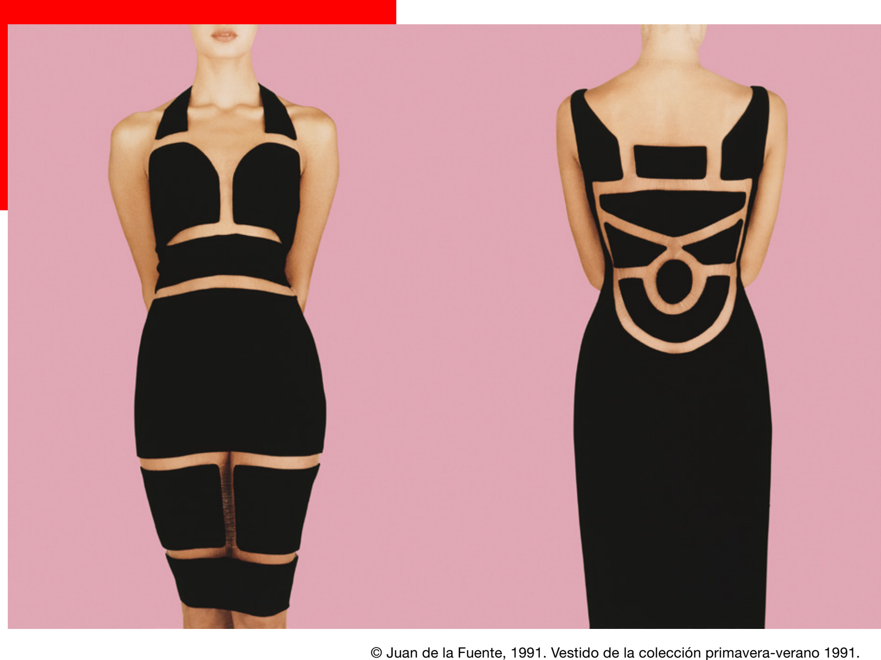
© Juan de la Fuente, 1991. Vestido de la colección primavera-verano 1991.