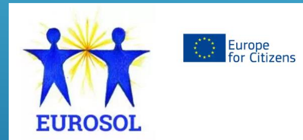
PROYECTO "EUROPEAN CITIZENS FOR SOLIDARITY" EURO SOL