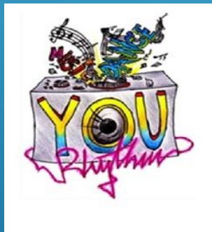
EUROPEAN YOUTH RHYTHM” – “YOURHYTHM”