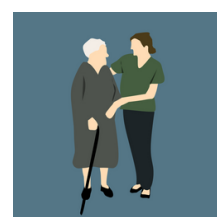
ENTIDADES PRIVADAS SIN ÁNIMO DE LUCRO