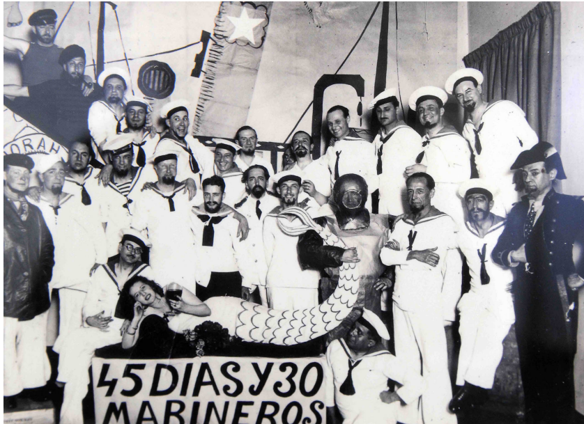
Norah Lange en la fiesta por la publicación de "45 días y 30 marineros".