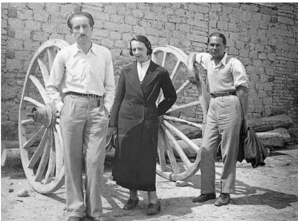
María Zambrano y Luis Cernuda en las Misiones Pedagógicas, ca. 1935

La tarde del 14 de abril de 1931 asiste en la Puerta del Sol a la proclamación de la II República Española. Hasta ese momento, la mujer ni votaba, ni era votada . Es la Constitución de la II República la que les reconoce el derecho a presentarse como candidatas. María Zambrano rechaza la oferta de presentar su candidatura a las Cortes por el PSOE. Ese mismo año comienza a trabajar como profesora en la universidad y colabora con artículos en distintas revistas. Comienza también a colaborar con algunas de las Misiones Pedagógicas.