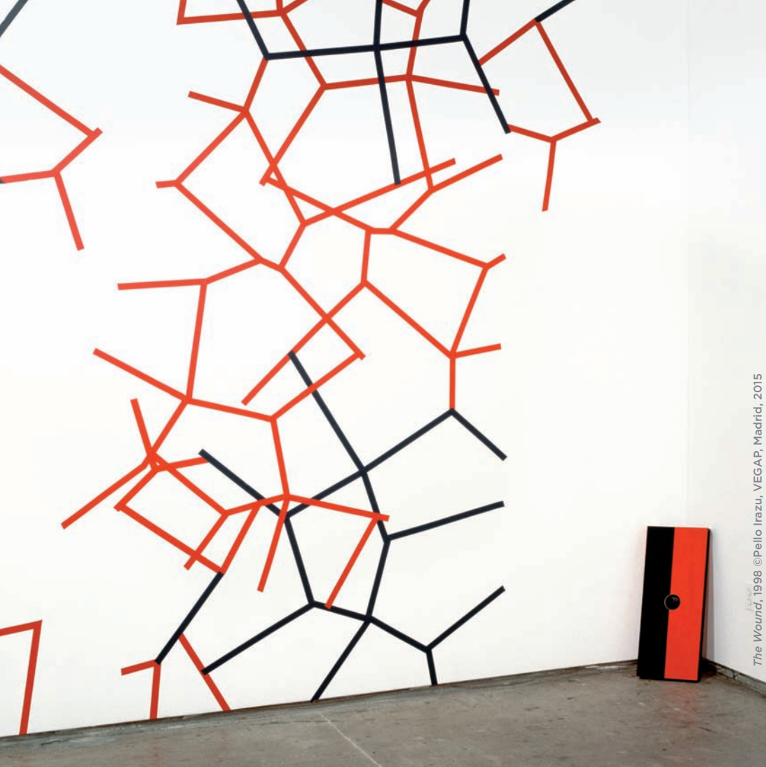
The Wound , 1998 ©Pello Irazu, VEGAP, Madrid, 2015