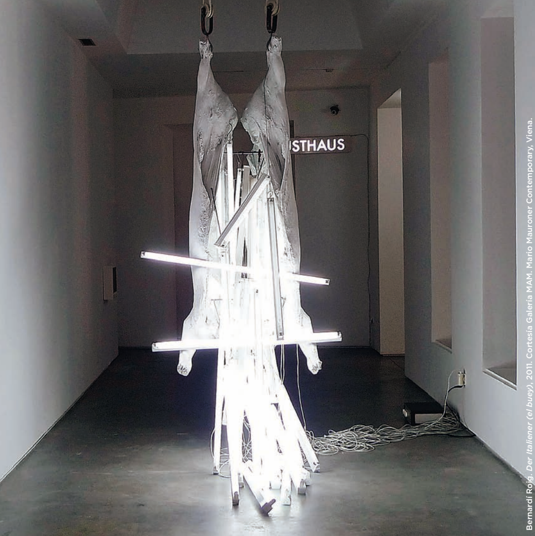
Bernardí Roig, Der Italiener (el buey) , 2011.