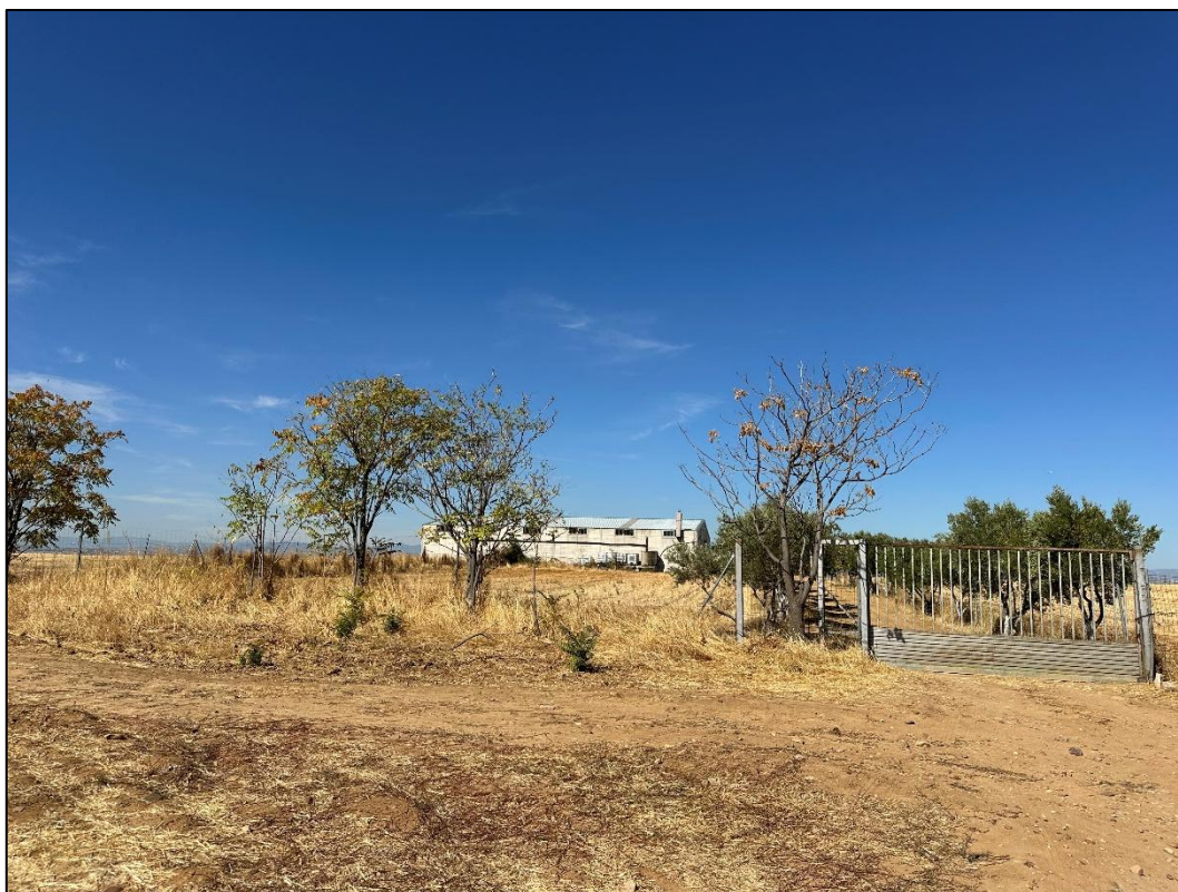
Imagen 9. Nave próxima al trazado de la línea de evacuación.