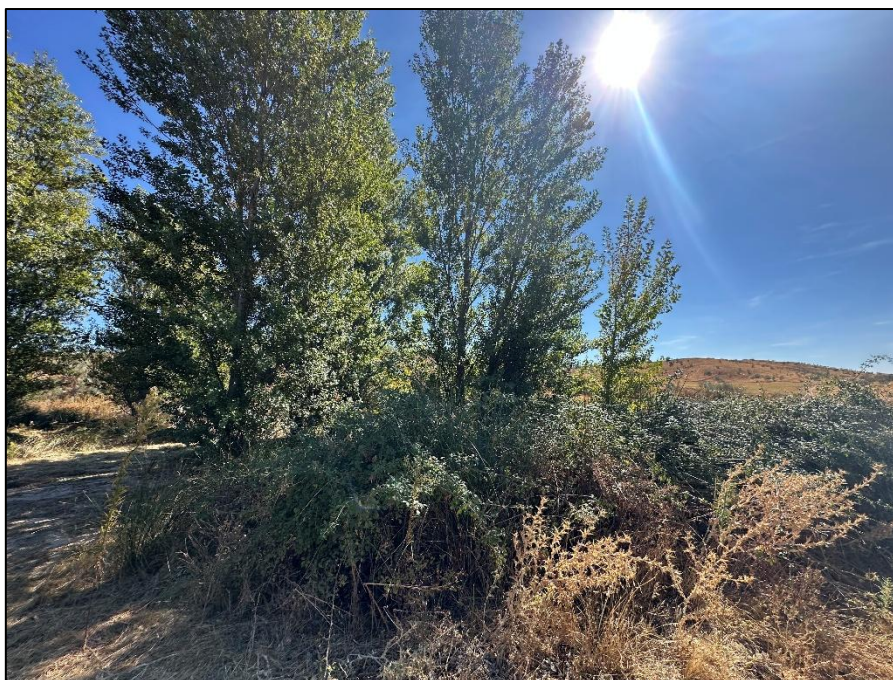
Imagen 5. Vegetación arborea de ribera próxima al ámbito de la planta solar, Arroyo de Quebrantarrejas.