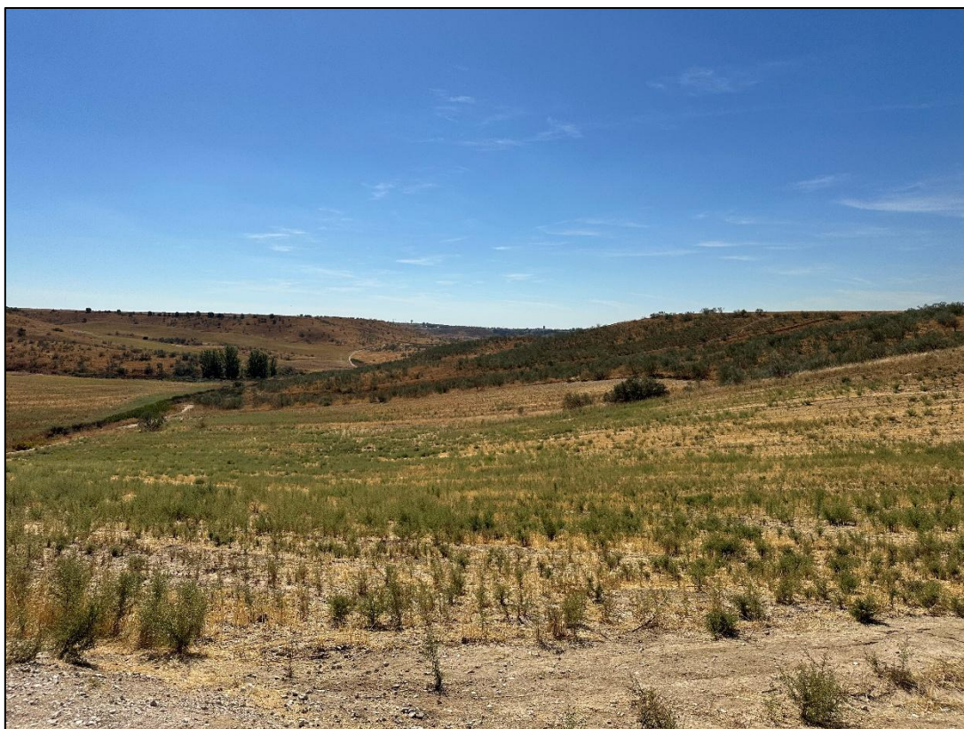
Imagen 7. Vegetacion natural, tierras en barbecho y cultivos de secano en el entorno de la planta solar.