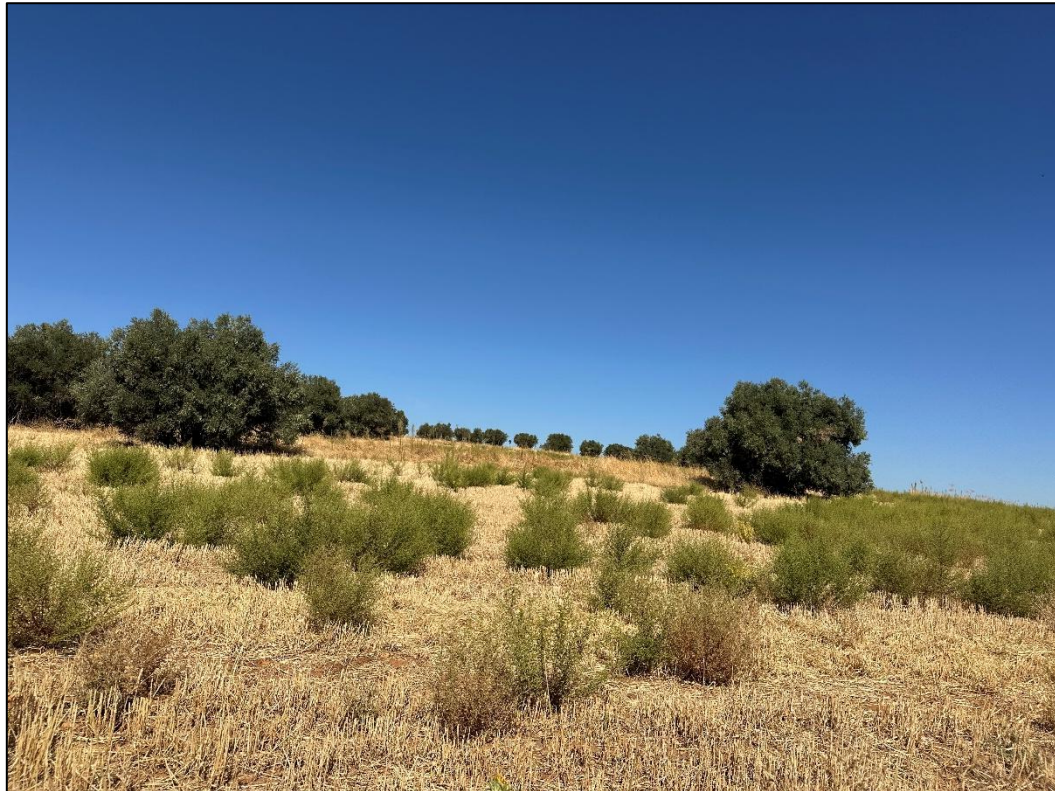
Imagen 12. Campos de cultivos con ejemplares de encina y matorrales en las inmediaciones del trazado de la línea de evacuación.