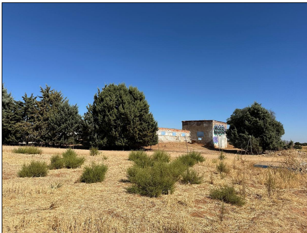
Imagen 8. Deposito dde agua de Ajalvir, próximo al recorrido de la línea de evacuacion.