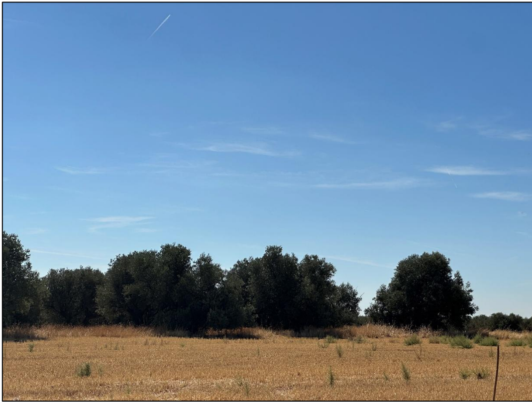
Imagen 3. Cultivo de secano con vegetación natural junto a olivar por la zona de paso de la línea de evacuación.