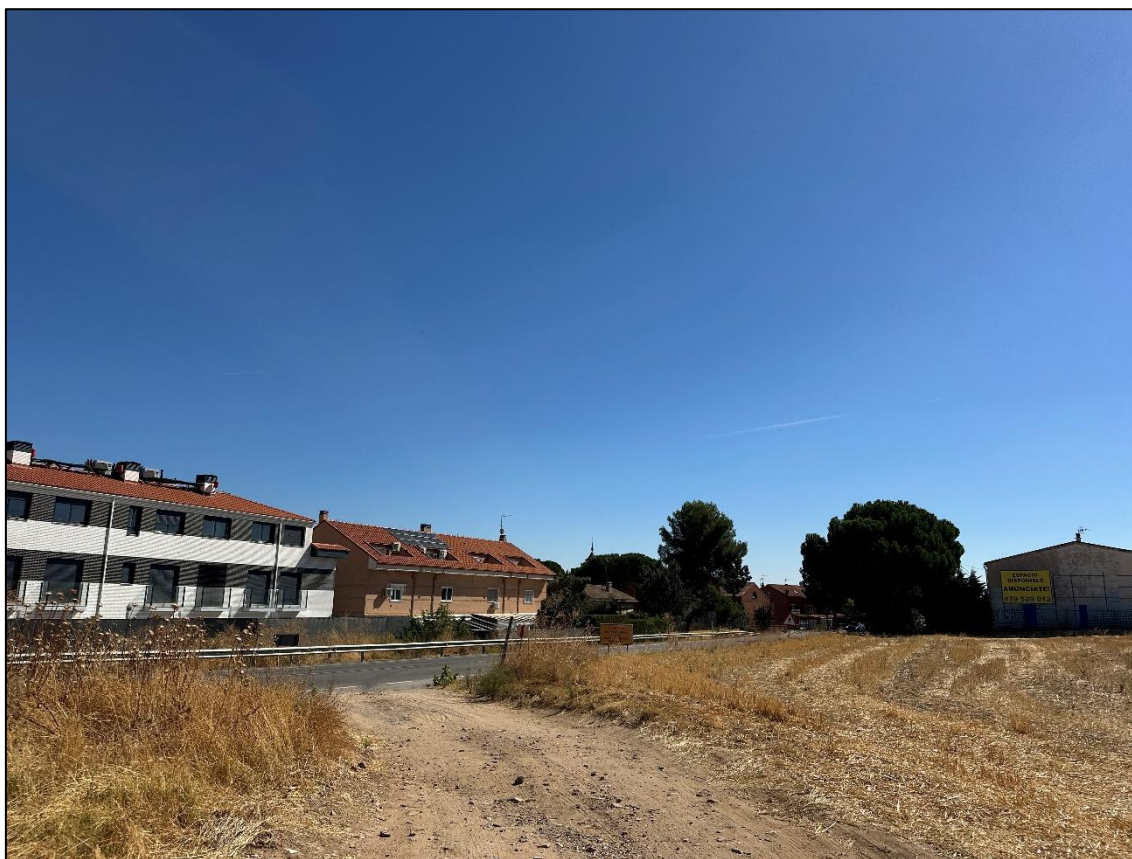
Imagen 10. Edificaciones de la localidad de Ajalvir.