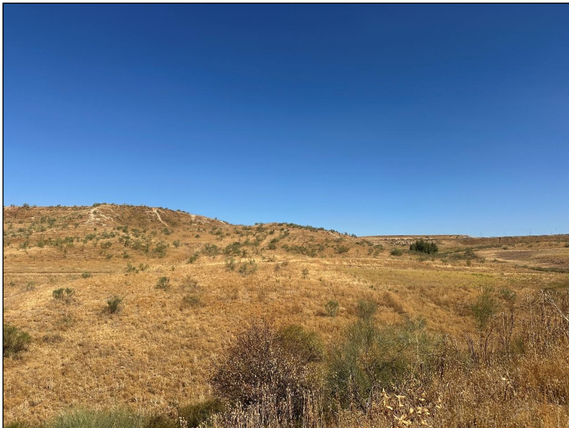
Imagen 2. Herbazal en la zona de la planta solar.