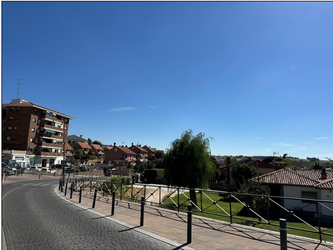
Imagen 11. Viviendas de la localidad de Daganzo de Arriba.