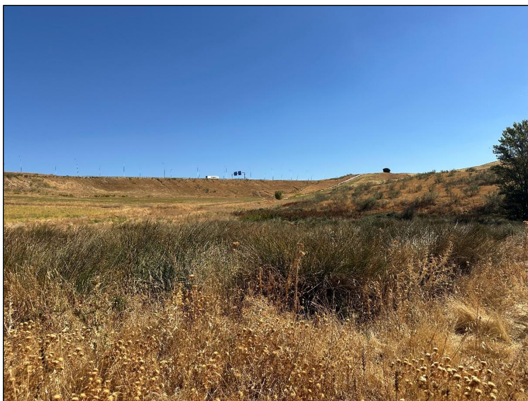
Imagen 6. Vegetación de matorral de ribera en las proximidades de la planta solar, Arroyo de Qubrantarejas. Fuente: elaboración propia.