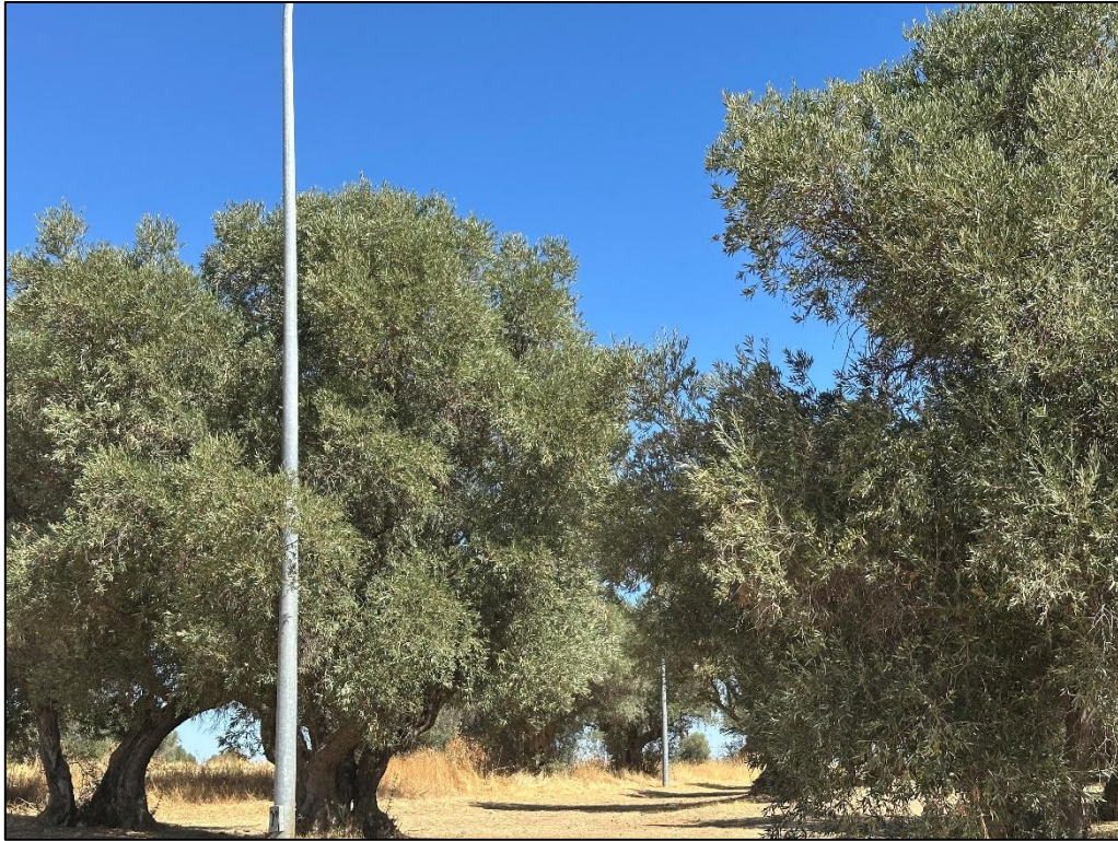
Imagen 13. Merendero en olivar en la ermita Nuestra Señora de la Espiga.