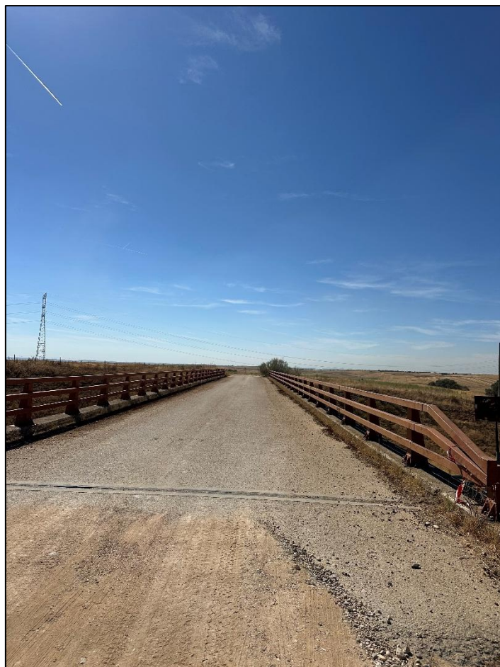
Imagen 16. Paso superior próximo al Centro de Seccionamiento.