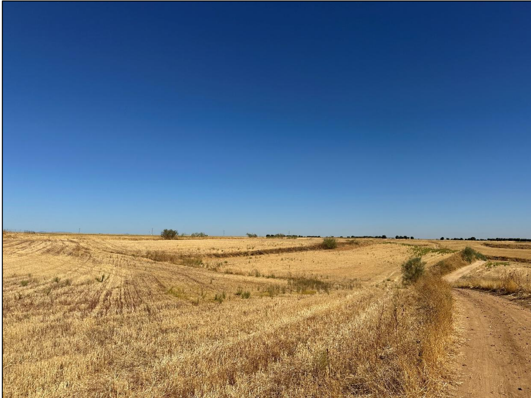
Imagen 1. Unidad de vegetación de cultivos herbáceos en el trazado de la línea de evacuación.