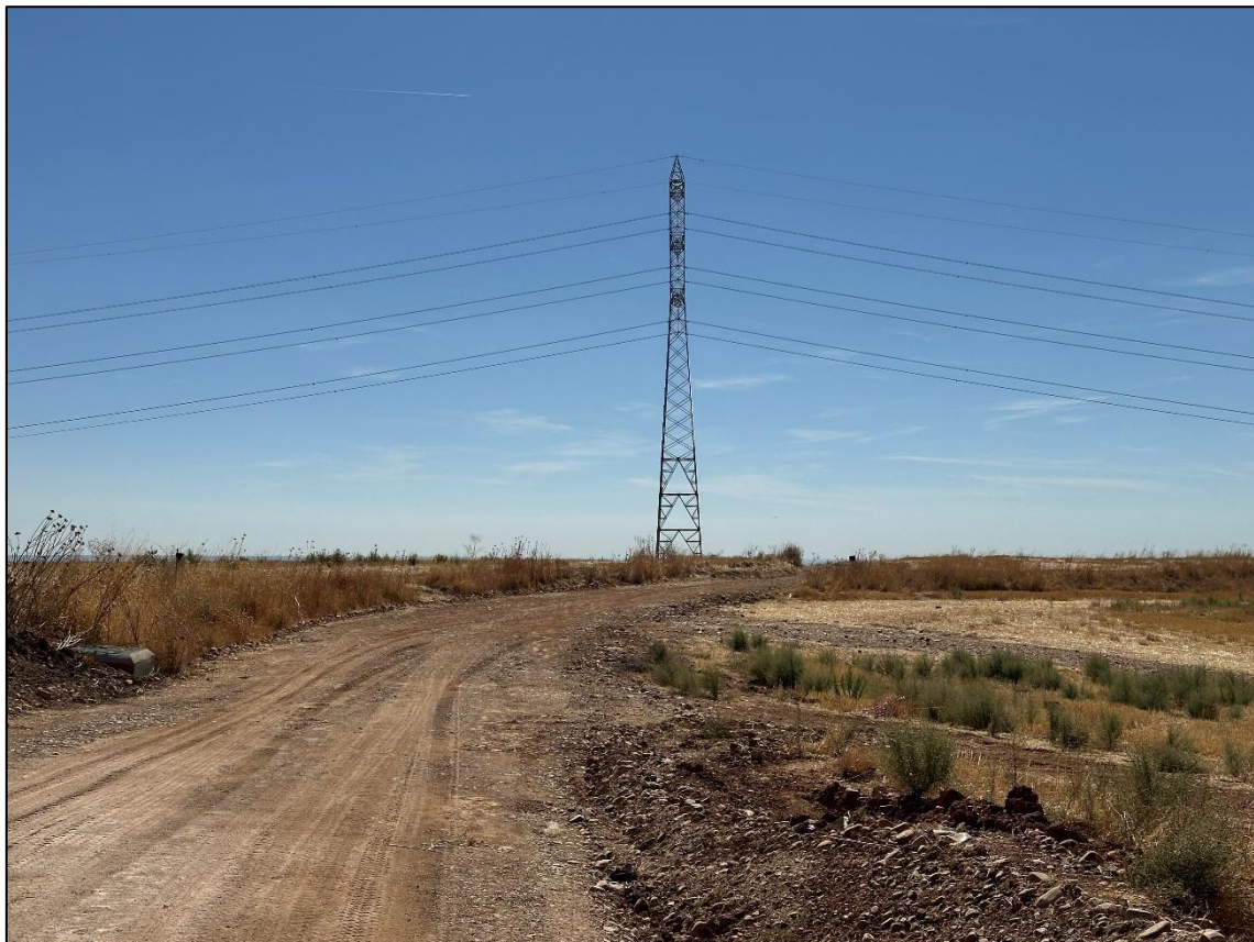
Imagen 14. Tendidos electricos próximos al trazado de la línea de evacuación.