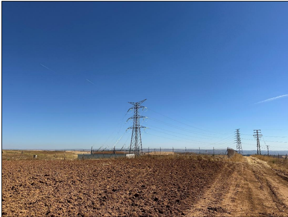
Imagen 15. Zona de localización del Centro de Seccionamiento.