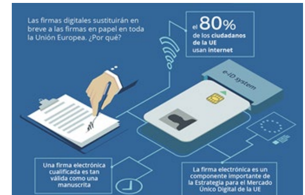
Infografía - La firma electrónica será pronto una práctica habitual

Un día después el Consejo adoptaría su posición sobre la creación de un portal digital único que proporcione información, procedimientos y asistencia en línea para los ciudadanos y las empresas. Esta posición, que se manifiesta como una orientación general, permitirá entablar negociaciones con el Parlamento Europeo.