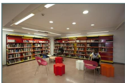
Biblioteca Chamberí "José Luis Sampedro"

Superficie útil: 3.267 m 2 Ejemplares: 138.800 Usuarios: 41.384 Usuarios nuevos: 2.592 Préstamos: 128.298 Visitantes: 206.362 Usuarios Internet: 53.338