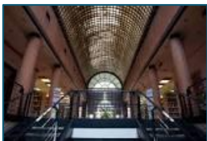
Biblioteca Retiro "Elena Fortún"

Superficie útil: 2.117 m 2 Ejemplares: 117.287 Usuarios: 49.608 Usuarios nuevos: 3.849 Préstamos: 165.771 Visitantes: 296.310 Usuarios Internet: 69.630