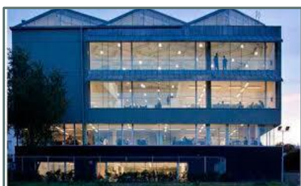
Biblioteca Carabanchel "Luis Rosales"

Superficie útil: 4.828 m 2 Ejemplares: 136.908 Usuarios: 39.666 Usuarios nuevos: 2.992 Préstamos: 124.015 Visitantes: 359.530 Usuarios Internet: 96.710