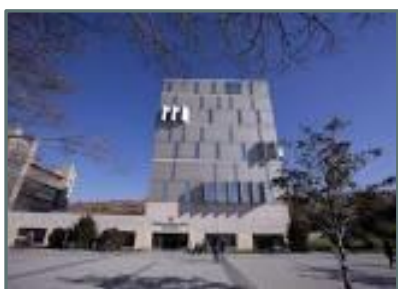
Biblioteca Usera "José Hierro"

Superficie útil: 3.751 m 2 Ejemplares: 134.315 Usuarios: 40.580 Usuarios nuevos: 3.833 Préstamos: 115.039 Visitantes: 248.592 Usuarios Internet: 110.254