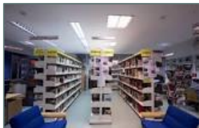
Biblioteca Moratalaz "Javier Marías"

Superficie útil: 576 m 2 Ejemplares: 75.375 Usuarios: 16.588 Usuarios nuevos: 862 Préstamos: 62.746 Visitantes: 81.419 Usuarios Internet: 12.261