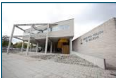
Biblioteca Puente de Vallecas "Miguel Hernández"

Superficie útil: 3.591 m 2 Ejemplares: 127.006 Usuarios: 39.265 Usuarios nuevos: 2.301 Préstamos: 96.963 Visitantes: 210.496 Usuarios Internet: 44.956