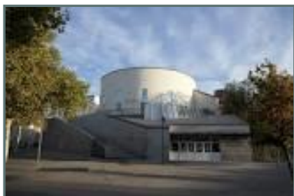
Biblioteca Centro "Pedro Salinas"

Superficie útil: 2.489 m 2 Ejemplares: 103.839 Usuarios: 56.319 Usuarios nuevos: 2.465 Préstamos: 104.051 Visitantes: 199.095 Usuarios Internet: 40.595