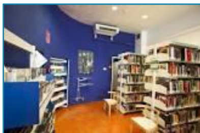
Biblioteca Ruiz Egea

Superficie útil: 250 m 2 Ejemplares: 31.924 Usuarios: 18.904 Usuarios nuevos: 1.248 Préstamos: 33.754 Visitantes: 52.294 Usuarios Internet: 9.300