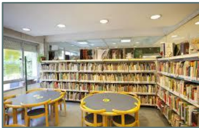
Biblioteca Moncloa-Aravaca "José Acuña"

Superficie útil: 588 m 2 Ejemplares: 58.861 Usuarios: 23.400 Usuarios nuevos: 1.779 Préstamos: 51.558 Visitantes: 182.801 Usuarios Internet: 26.861