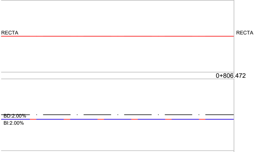
DIAGRAMA DE PERALTES