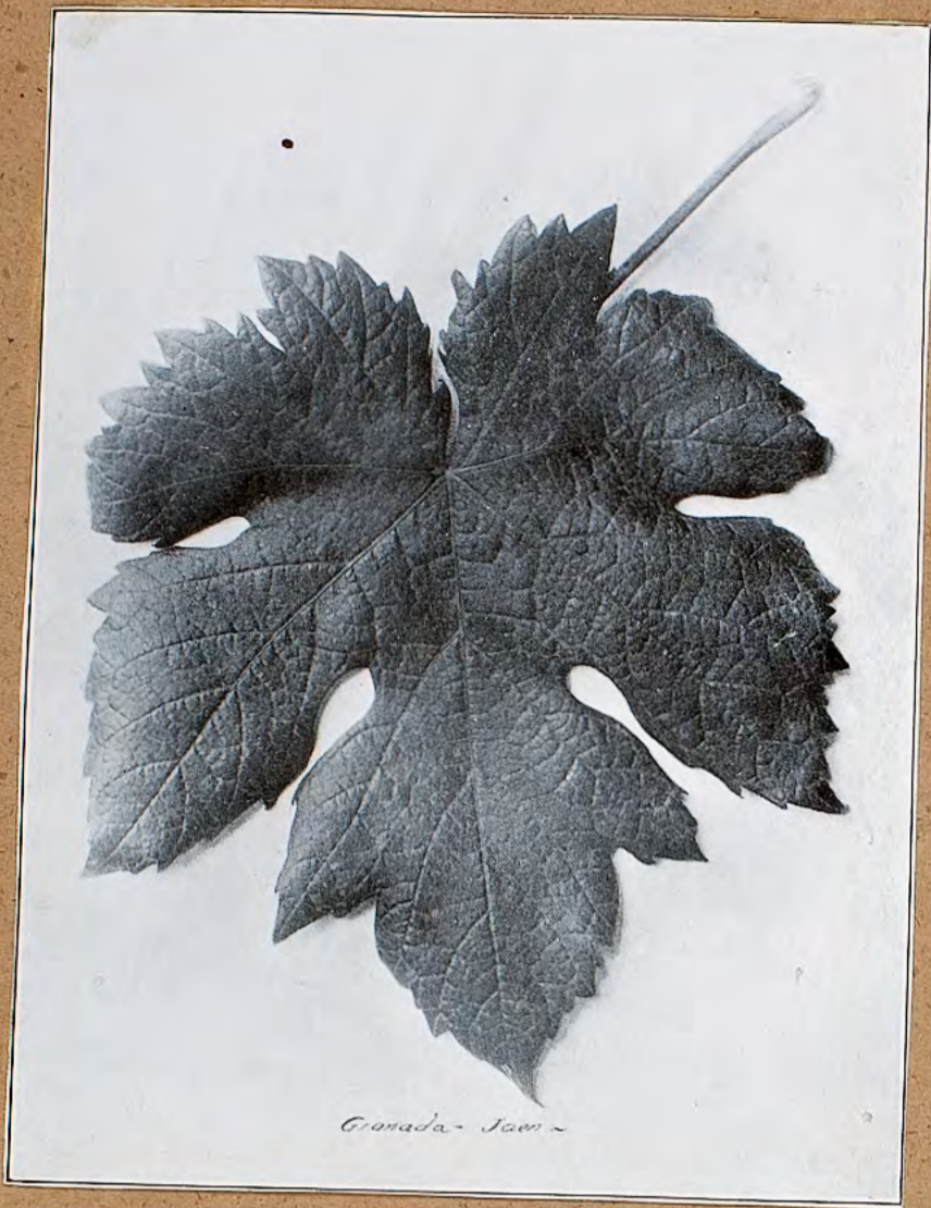
Gronada - Jaen -