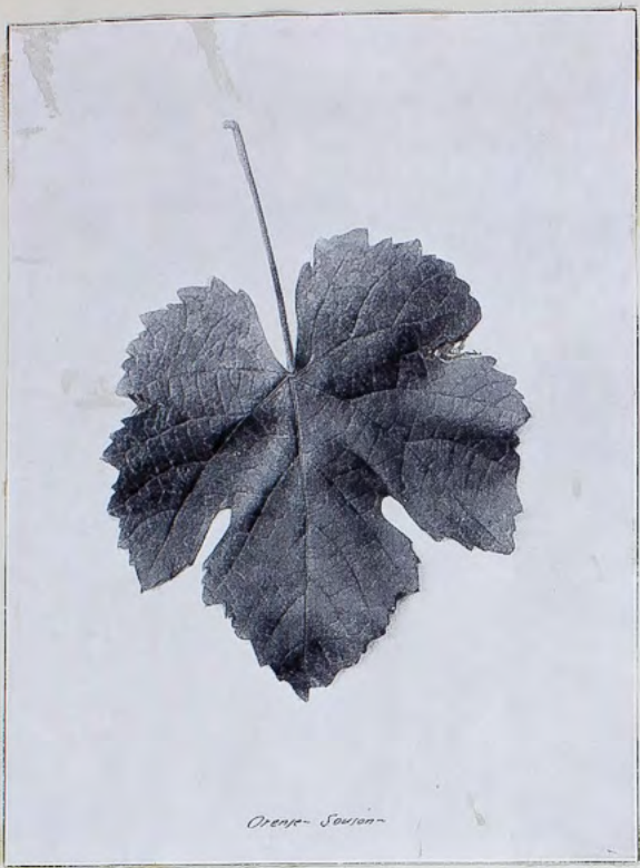
Orient - Souzon