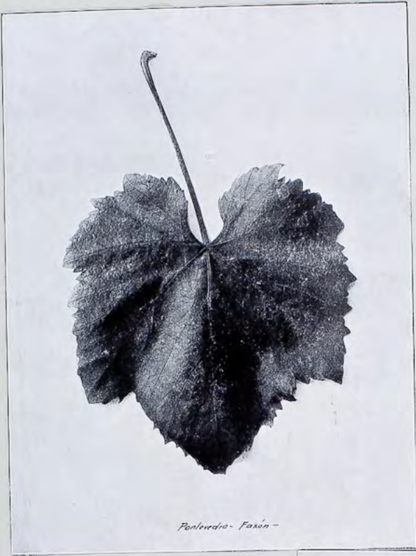
Portevada - Faxón -