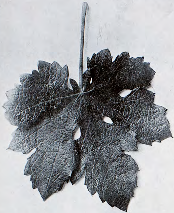
Granada - Perruno