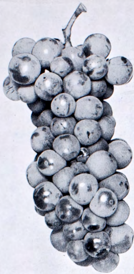
Chasselas doree (1205)