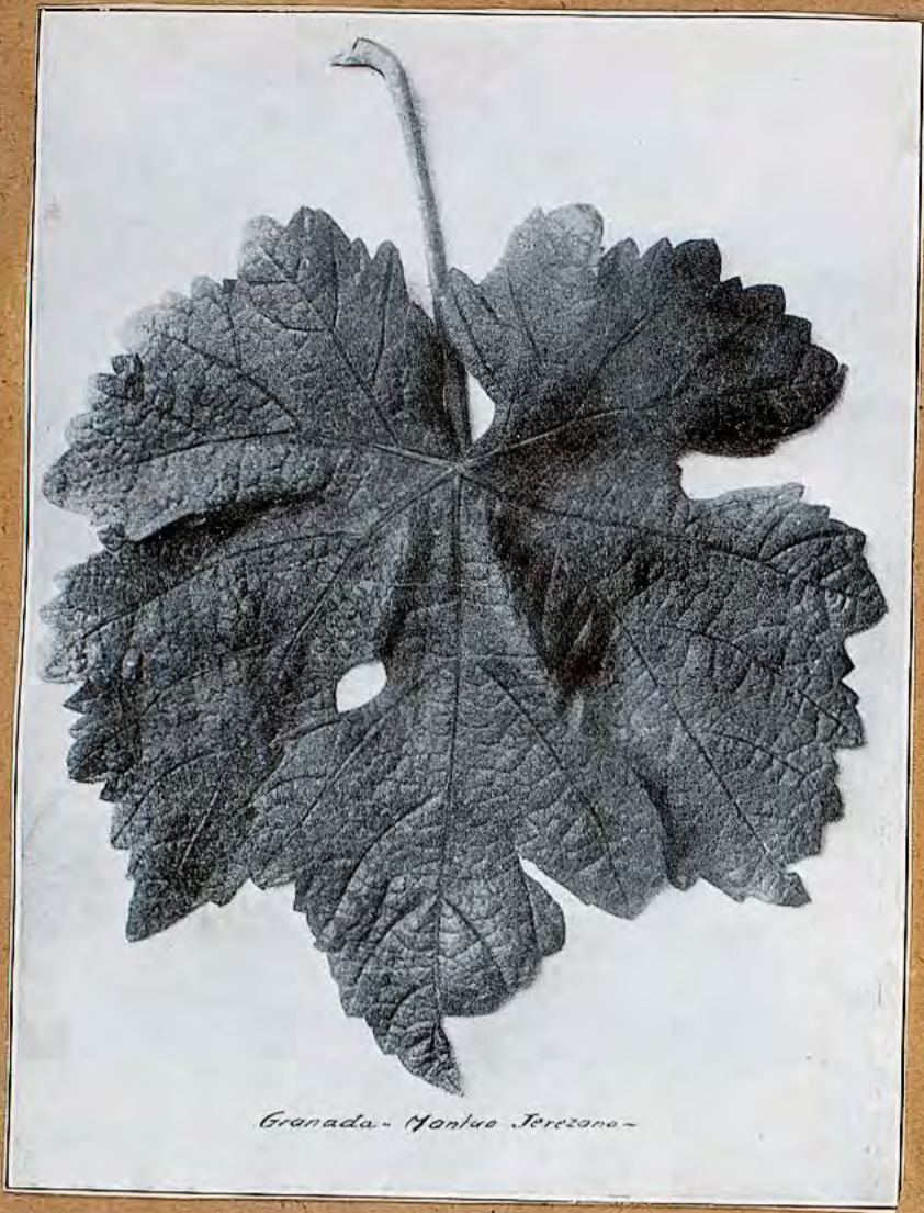
Gronada - Montec. Terzano -