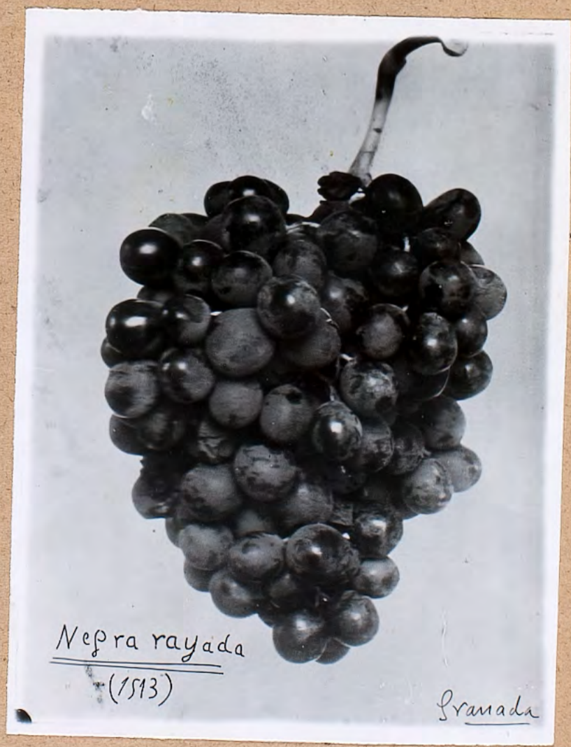
Neptra rayada (1513)