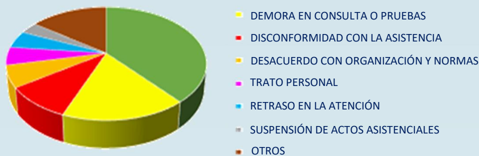
Reclamaciones por motivo año 2016