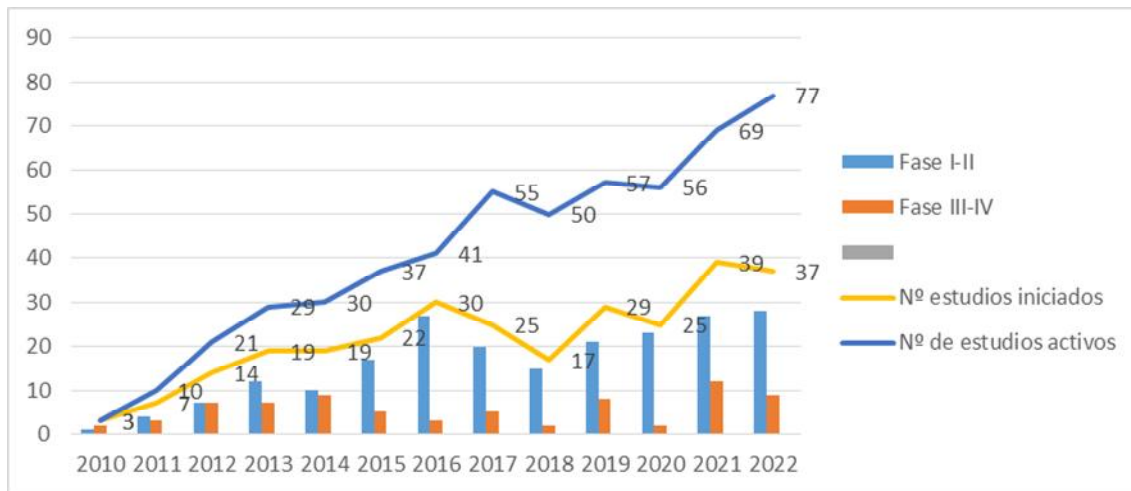
Fig 1. Nº de EC que se inician cada año (divididos según la fase) y número acumulado de EC activos cada año (en los que hay visitas de pacientes)

Durante el año 2022, en la unidad de ensayos clínicos se han realizado ingresos de 77 EC llevados a cabo por diferentes servicios del hospital. En estos gráficos se representa el porcentaje de participación de éstos servicios en relación al número de ensayos clínicos activos y número de pacientes atendidos en la unidad.