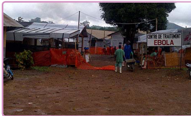
Centro de tratamiento de ébola en Guinea

confundirse con la enfermedad por ébola. Se planea para las próximas semanas el inicio en Liberia del primer ensayo fase-III de la vacuna candidato cAd3-EBO (NIAID/GSK).