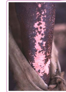
"Piel de leopardo" en oncocercosis

En el próximo boletín, se revisan el diagnóstico, el tratamiento y las principales medidas de prevención de esta infección.